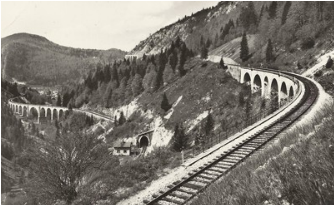
Photo ancienne de la ligne et de l'entrée du tunnel en contre-bas