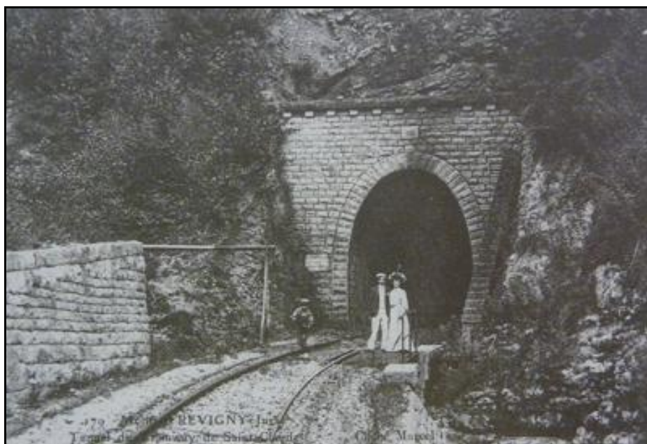
Souvenir d'antan : la promenade jusqu'à l'entrée du tunnel

Si cette fiche comporte des erreurs ou des oublis, merci de nous le signaler.