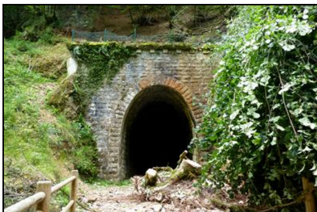
Un éboulement a eu lieu à l'entrée du tunnel