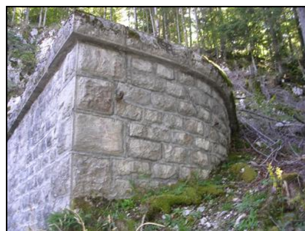
Détail du mur en retour de la sortie

Si cette fiche comporte des erreurs ou des oublis, merci de nous le signaler.