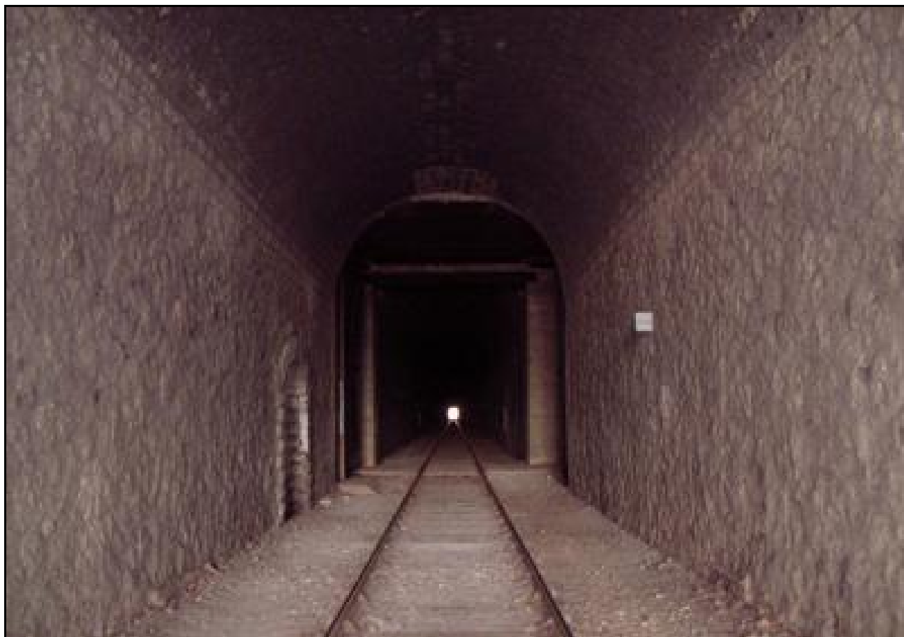
Ci-dessus et ci-dessous, deux belles photos de la galerie avec l'une de ses portes blindées