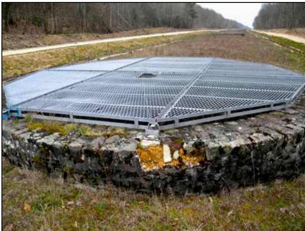
Gros plan sur le toit de la galerie et le débouché en surface d'une des 21 cheminées d'aération Une autre cheminée visible en arrière plan