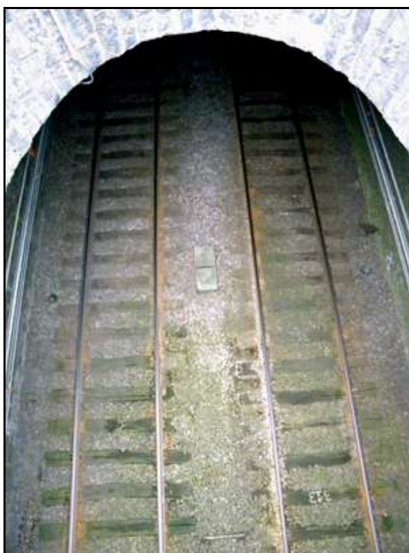
La sortie de la galerie

Si cette fiche comporte des erreurs ou des oublis, merci de nous le signaler.