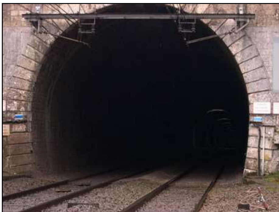
Sur cette belle photo de l'entrée, on devine les premières cheminées d'aération dans la voûte