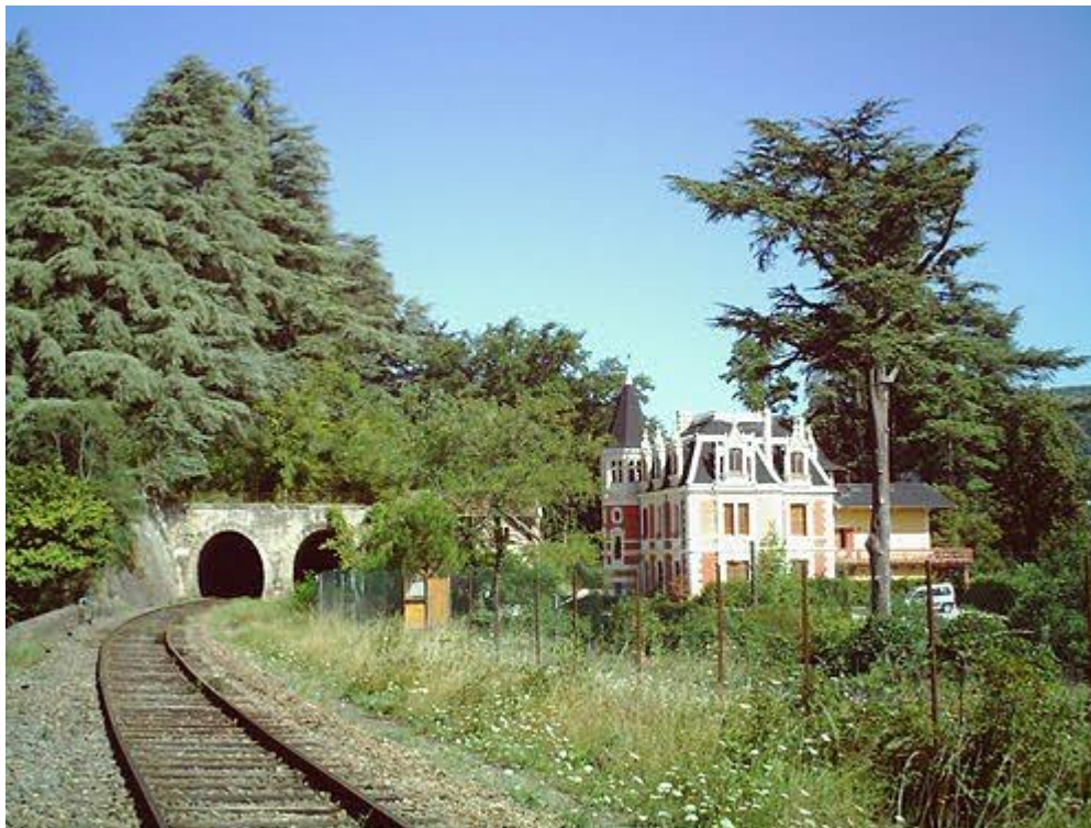
Le château familial d'André Chapelon

Si cette fiche comporte des erreurs ou des oublis, merci de nous le signaler.