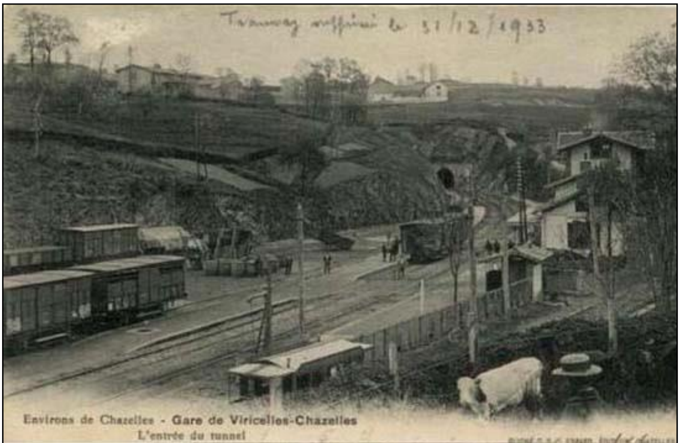
Belle photo ancienne de la gare de Viricelles et de la sortie du tunnel tout au fond Au premier plan, le tramway métrique de la ligne vers Saint-Symphorien-sur-Coise (Rhône)