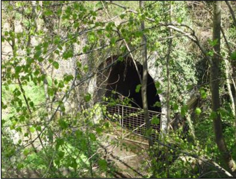
INTERIEUR DU TUNNEL