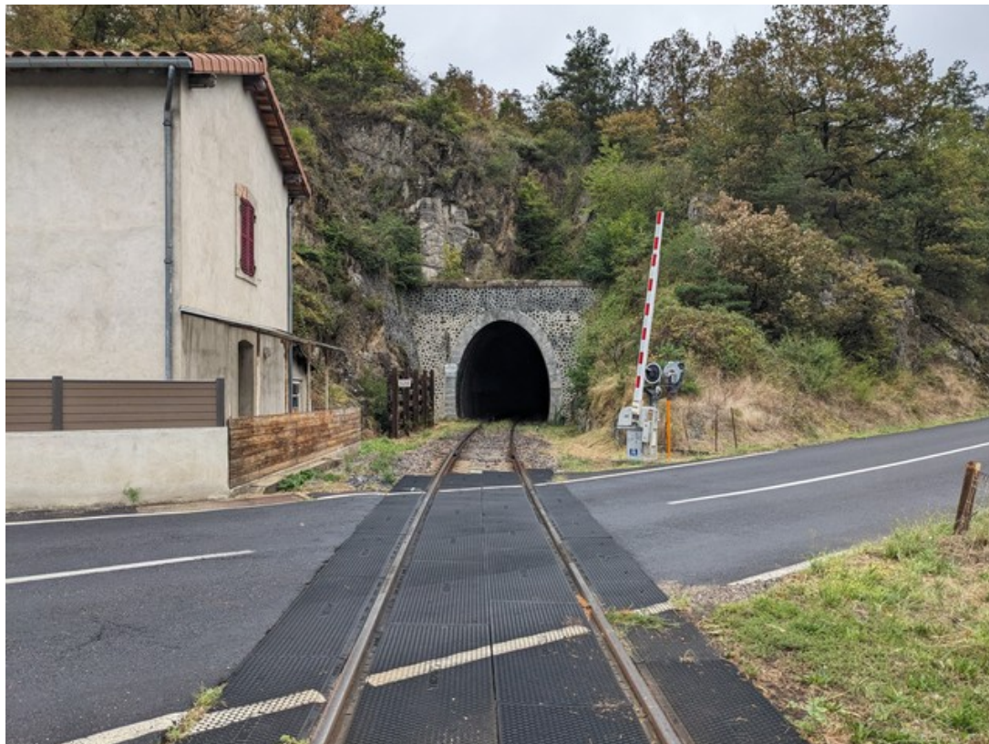
Au premier plan, le PN 95 (28/08/2023)