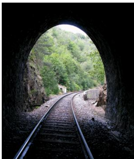
Ci-dessous, la sortie du tunnel de Jacquet vue depuis l'entrée du tunnel de Douchanez