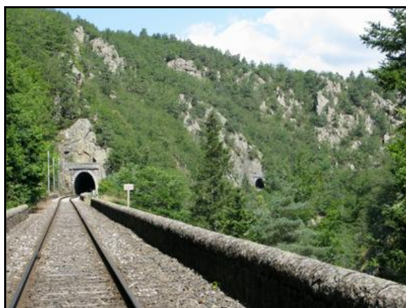
A droite, la sortie du tunnel de Saint Didier