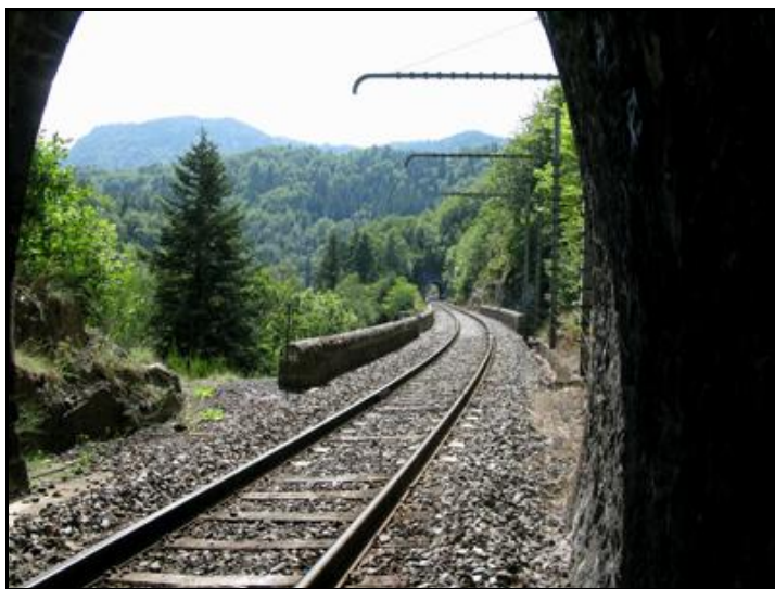
Au fond, l'entrée du tunnel de Faire Grosse

Si cette fiche comporte des erreurs ou des oublis, merci de nous le signaler.