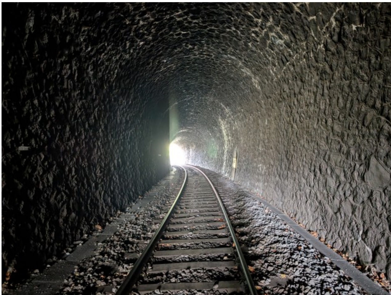
Vue de l'intérieur vers la sortie

Si cette fiche comporte des erreurs ou des oublis, merci de nous le signaler. Envoyez-nous vos photographies et documents pour la compléter.