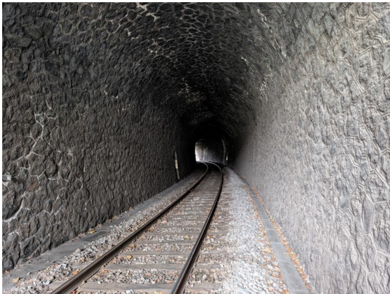
Vue depuis l'entrée