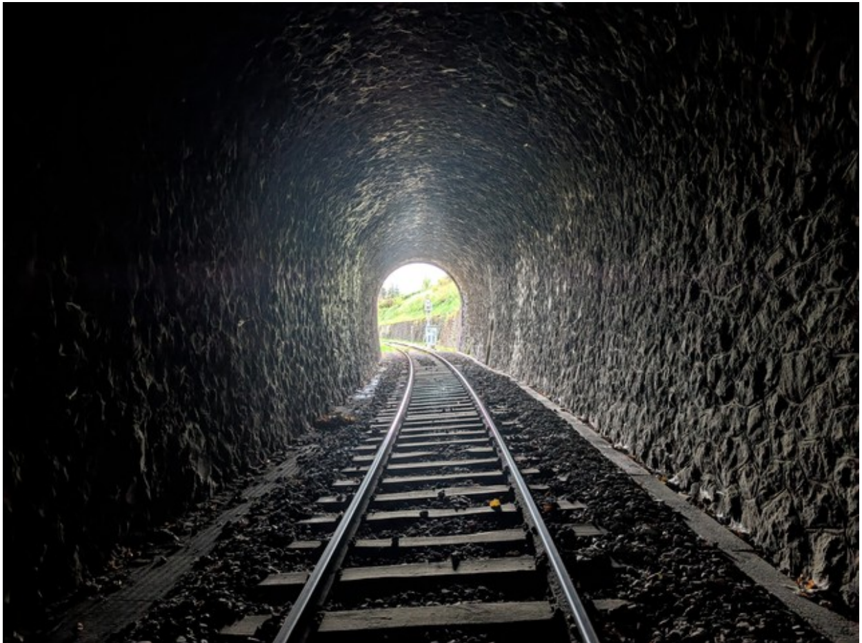
Vue vers la sortie