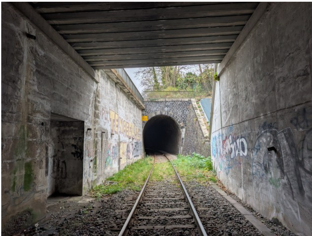
Vue depuis la sortie de la galerie Maréchal Foch