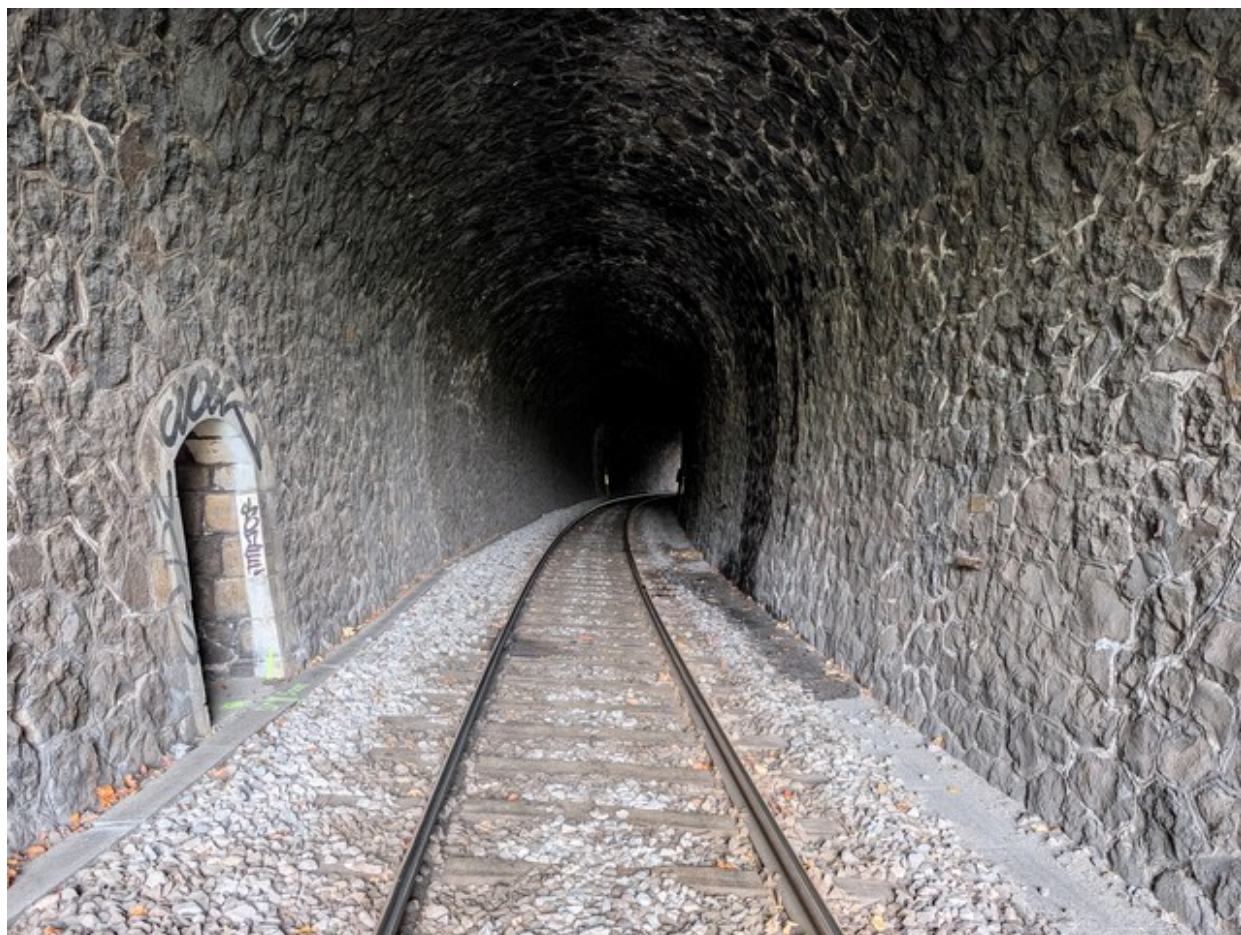
Vue depuis la sortie