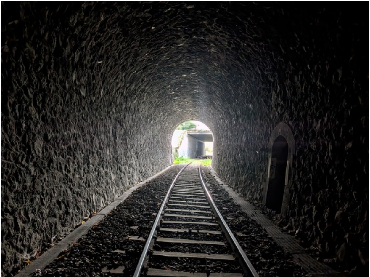
Vue vers l'entrée