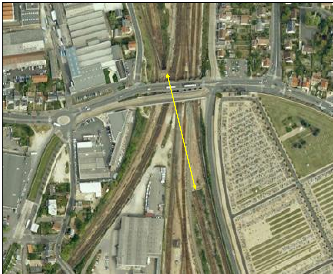
Vue aérienne du saut de mouton des Aubrais

Si cette fiche comporte des erreurs ou des oublis, merci de nous le signaler.