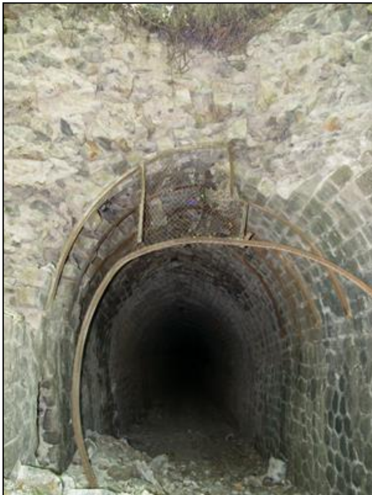
Ci-dessus et ci-dessous, l'intérieur de la galerie passablement abîmé et dangereux avec ses cintres de soutènement disloqués