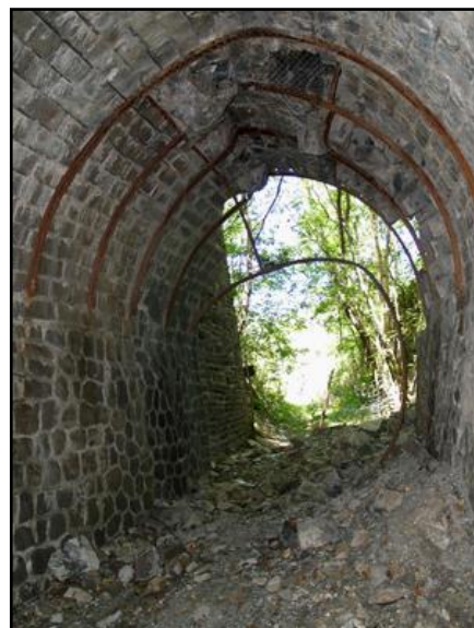
Les cintres et la voûte disloqués à la sortie du tunnel