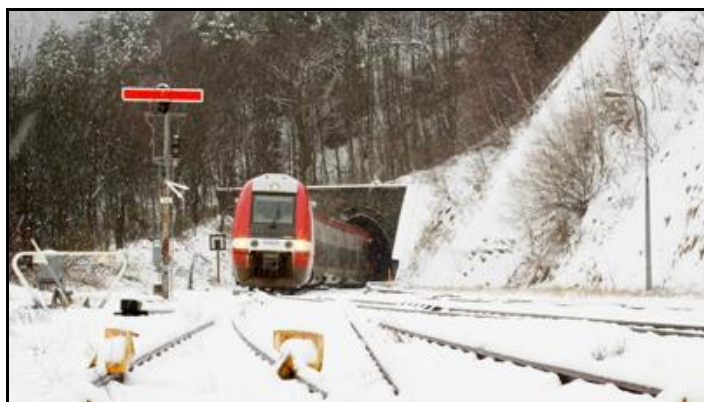
Un AGC entre en gare de Villefort par temps de neige