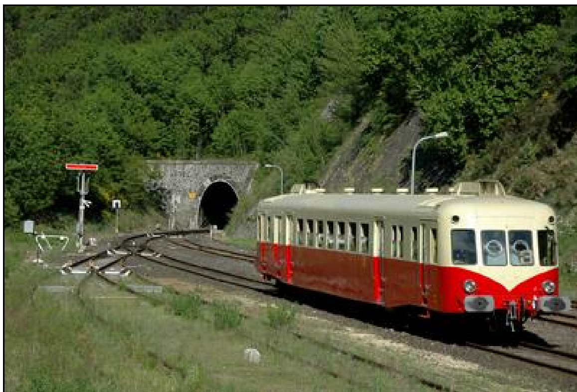
Ci-dessus et ci-après, différentes scènes de vie du tunnel de Villefort