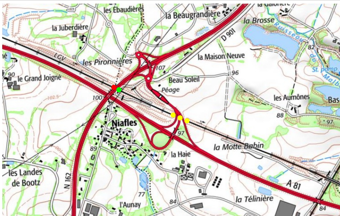
En jaune, la tranchée couverte de la A81 (n° 53140.1)