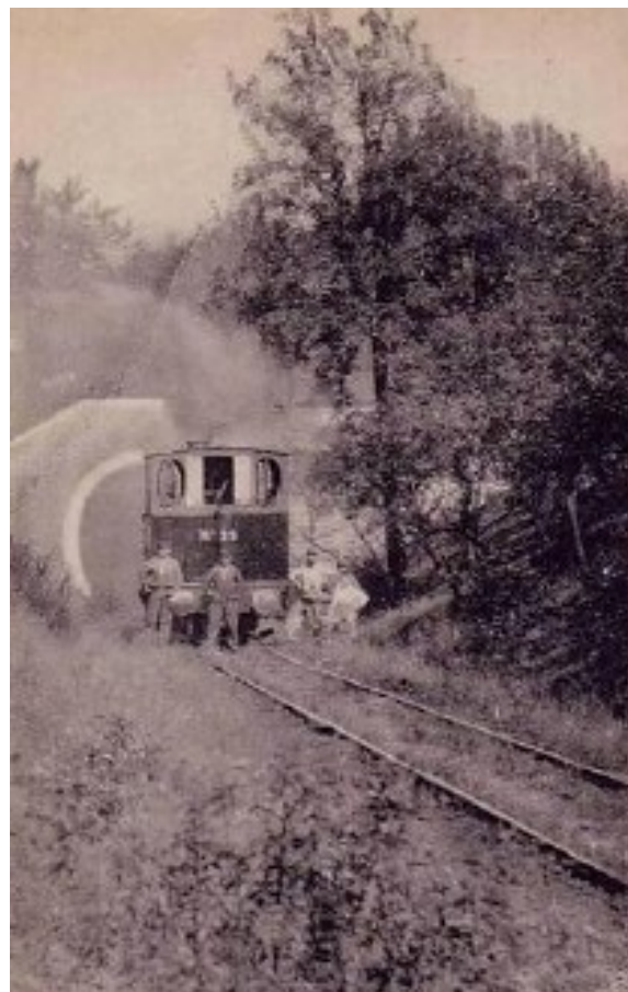
La sortie du temps de l'exploitation de la ligne