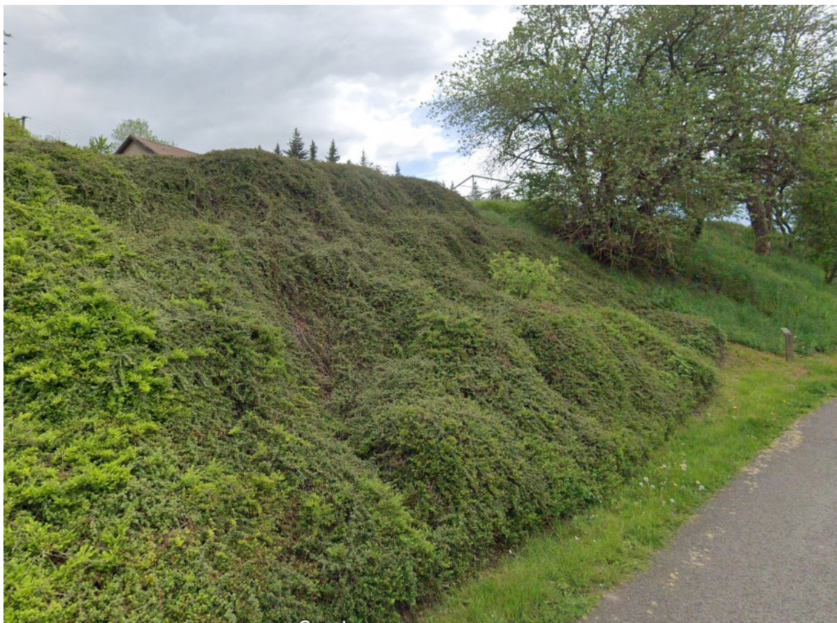
L'emplacement de la sortie aujourd'hui comblée

Si cette fiche comporte des erreurs ou des oublis, merci de nous le signaler. Envoyez-nous vos photographies et documents pour la compléter.