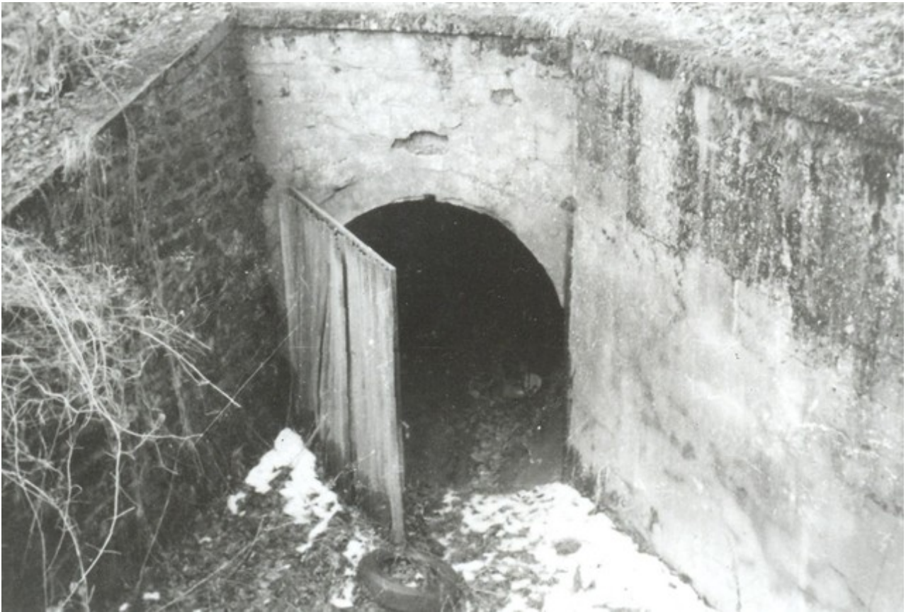
La sortie avant son comblement.