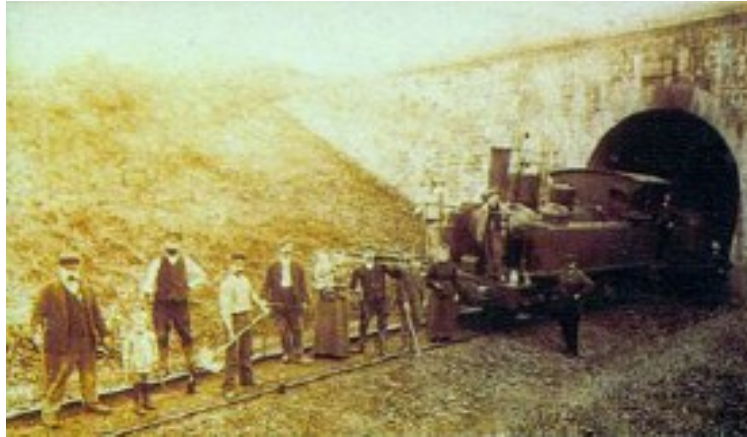
L'entrée lorsque la ligne était exploitée.