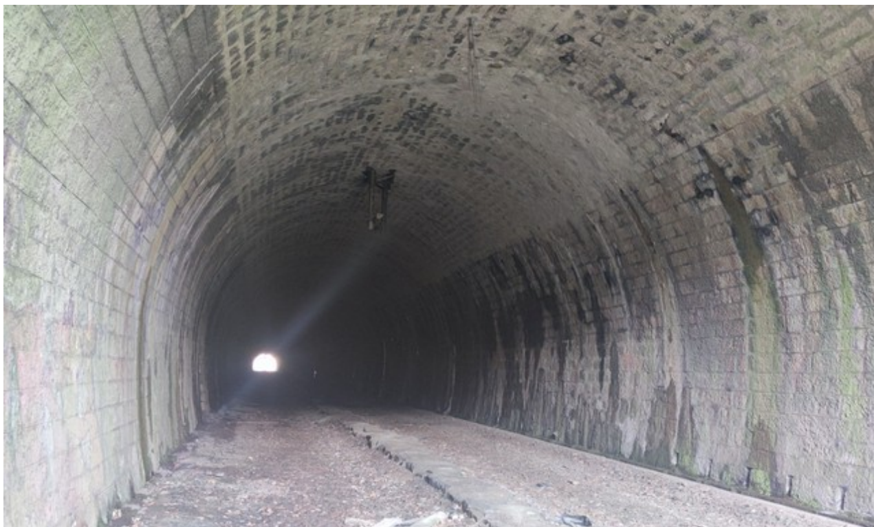
Vue en direction de l'entrée depuis la sortie (01/04/2026)