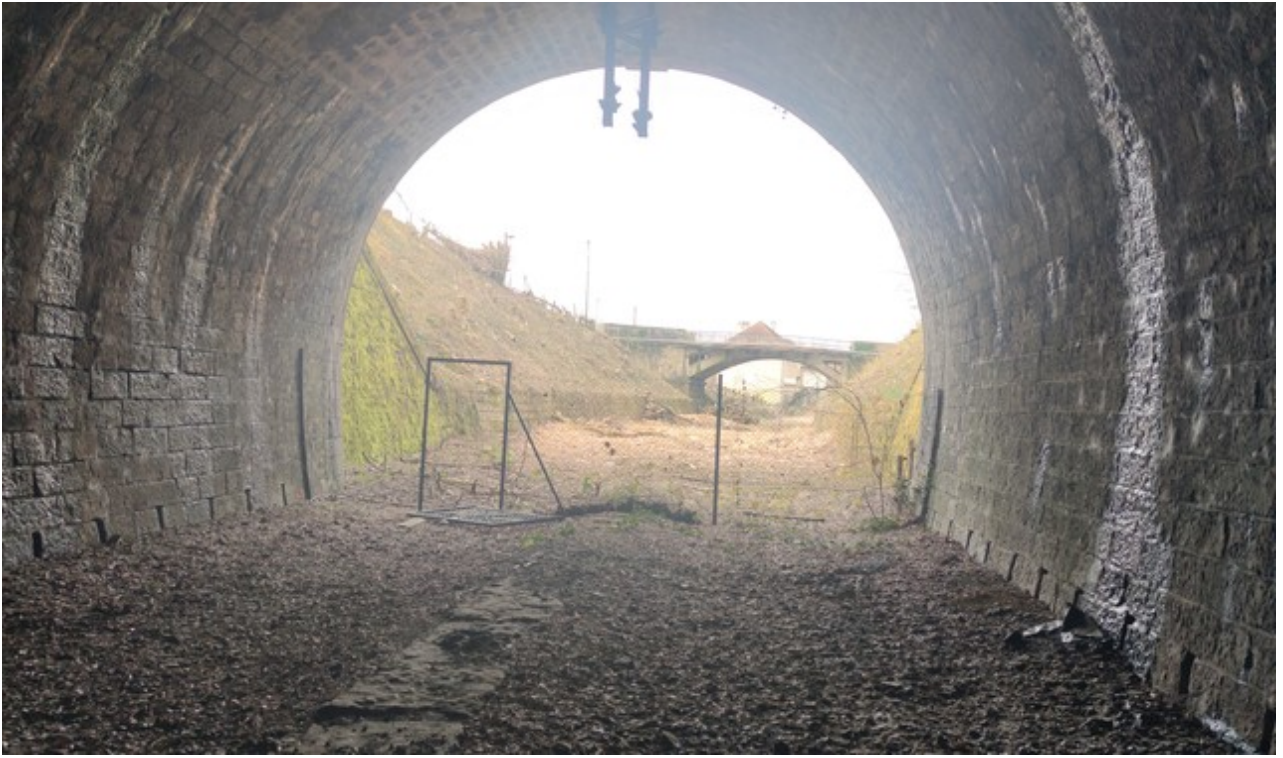
Vue de l'entrée depuis l'intérieur du tunnel (01/04/2026)