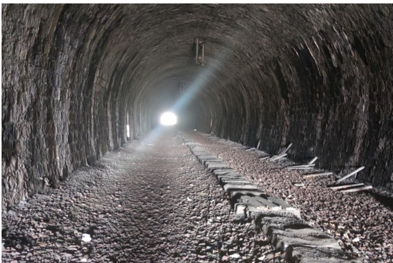
Vue en direction de la sortie depuis l'entrée (01/04/2026)

Si cette fiche comporte des erreurs ou des oublis, merci de nous le signaler. Envoyez-nous vos photographies et documents pour la compléter.