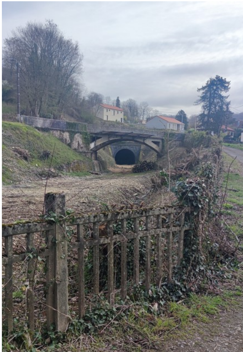
Vue de l'entrée (01/04/2026)