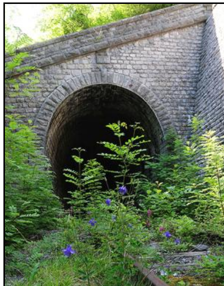
L'entrée et la sortie du tunnel aujourd'hui