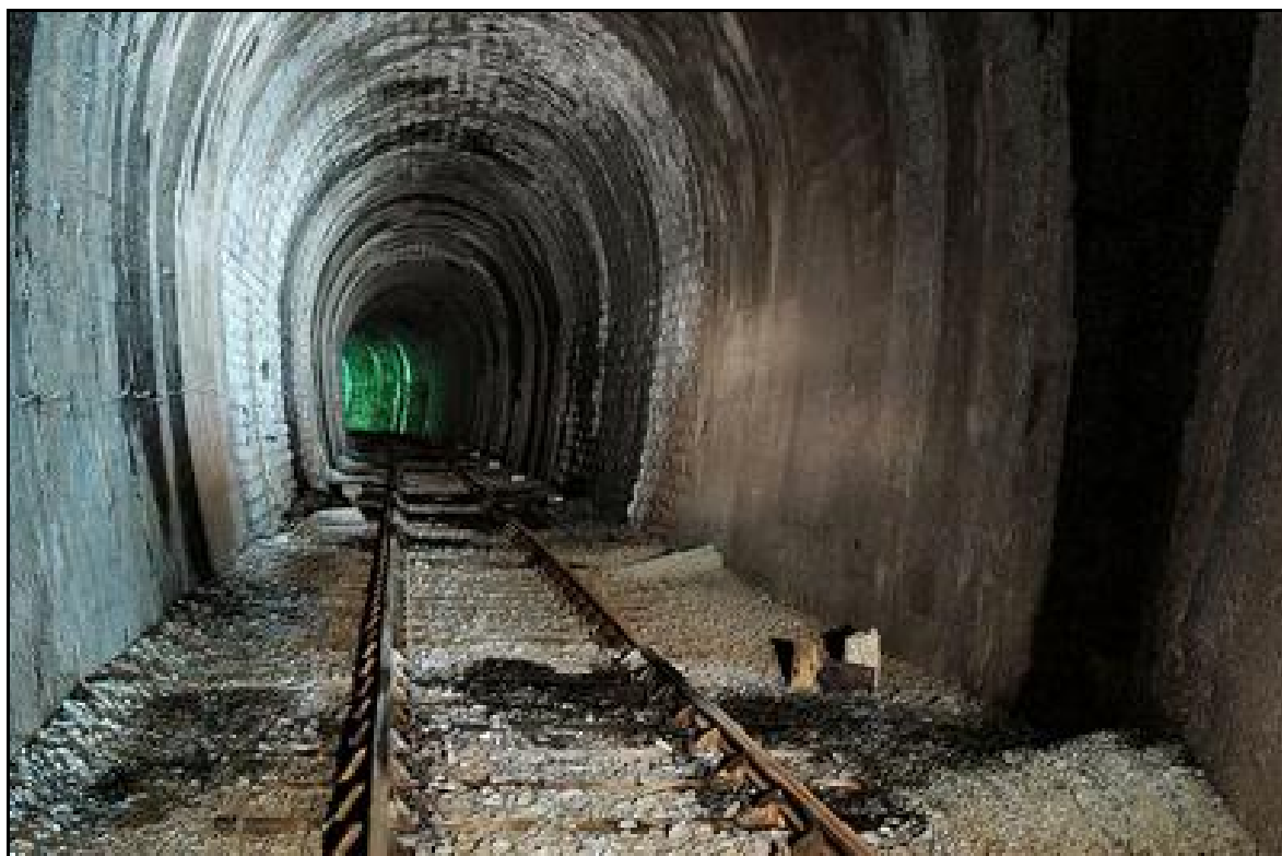
Ci-dessus et ci-dessous, divers aspects de la galerie