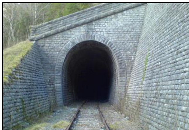
L'entrée et la sortie du tunnel peu après une inutile opération de débroussaillage