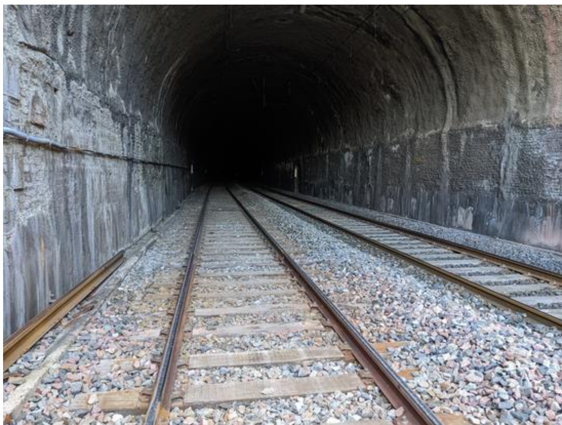
Intérieur du tunnel vu depuis l'entrée