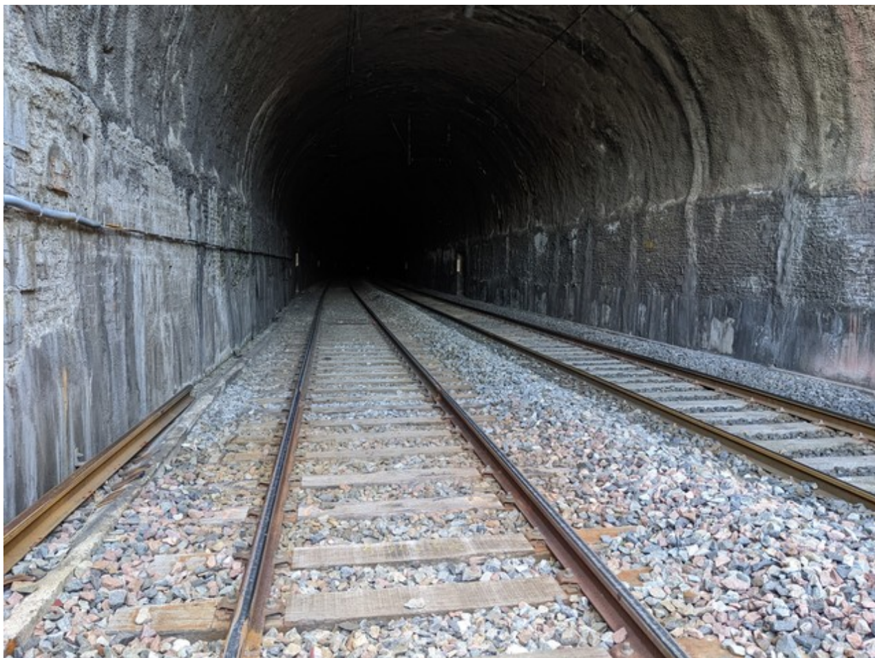
L'intérieur du tunnel vu depuis l'entrée (02/12/2022)

Si cette fiche comporte des erreurs ou des oublis, merci de nous le signaler. Envoyez-nous vos photographies et documents pour la compléter.