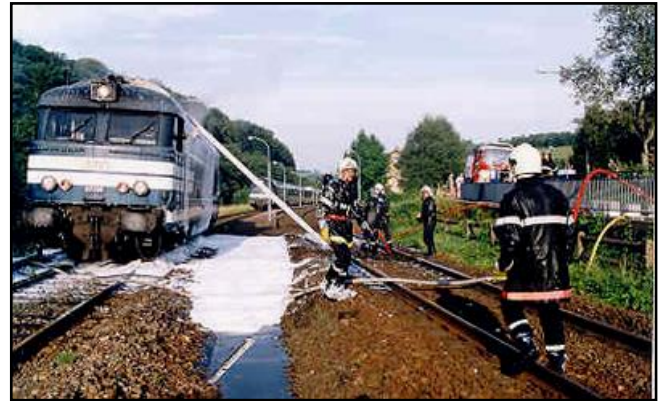
La machine en feu dans la gare de Tieffenbach