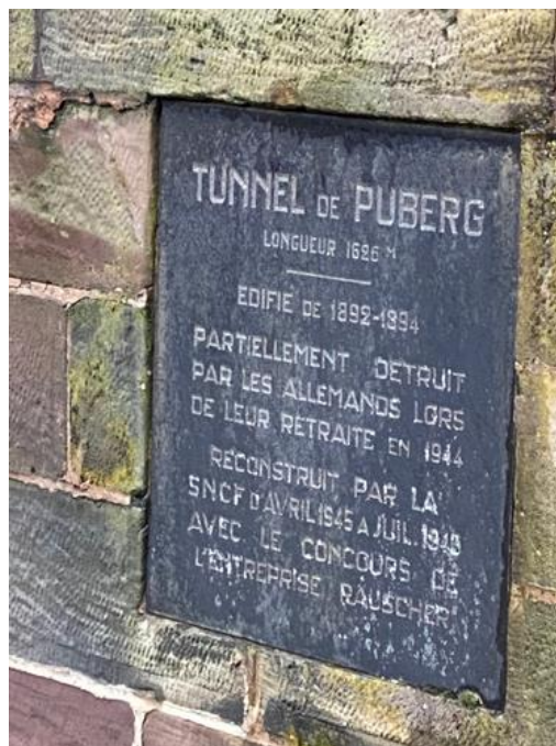
Plaque commémorative à l'entrée du tunnel

Ci-dessus, à gauche de la voie, avant l'entrée du tunnel, une porte murée qui semble correspondre à un ancien poste de garde militaire souterrain