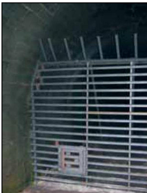
Détail de l'installation destinée à interdire la fréquentation du tunnel et à protéger les chauves-souris