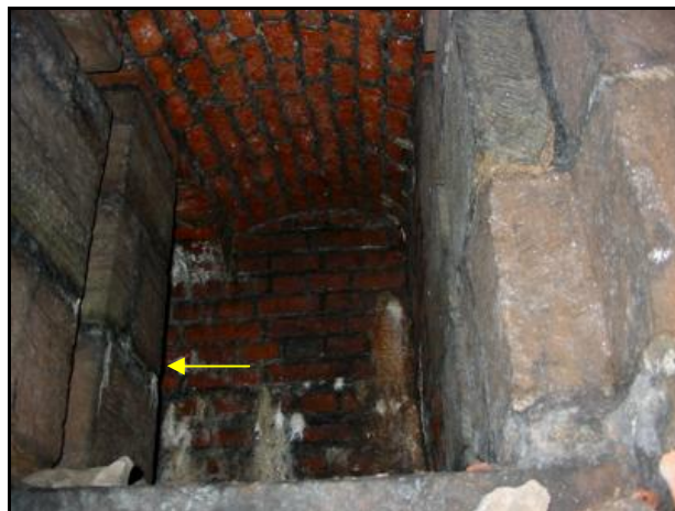
Le fourneau ouvert

La flèche jaune indique la niche du fond