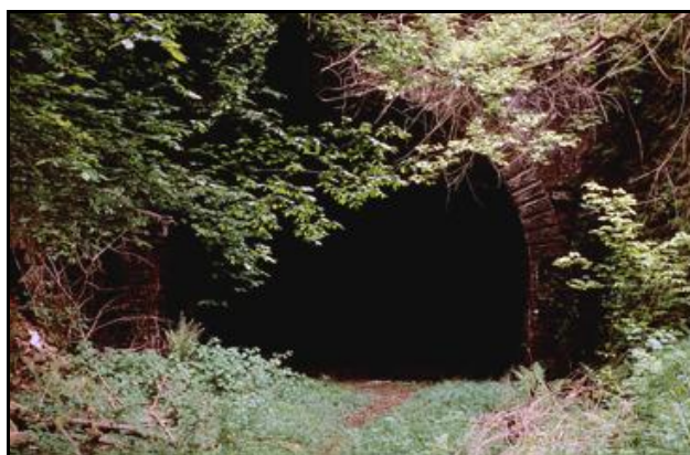
L'entrée et la sortie du tunnel dans leur état initial avant fermeture