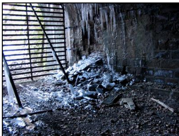
Ci-dessus et ci-dessous, effets du gel

Bien entendu, son abandon n'a pas amélioré les choses et voûte et piédroits commencent à donner des signes de faiblesse évidents. Le parement a éclaté en deux nombreux endroits sous les effets des gels successifs comme en témoignent les photos ci-dessous.