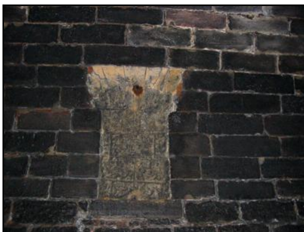
Fourneau de minage muré