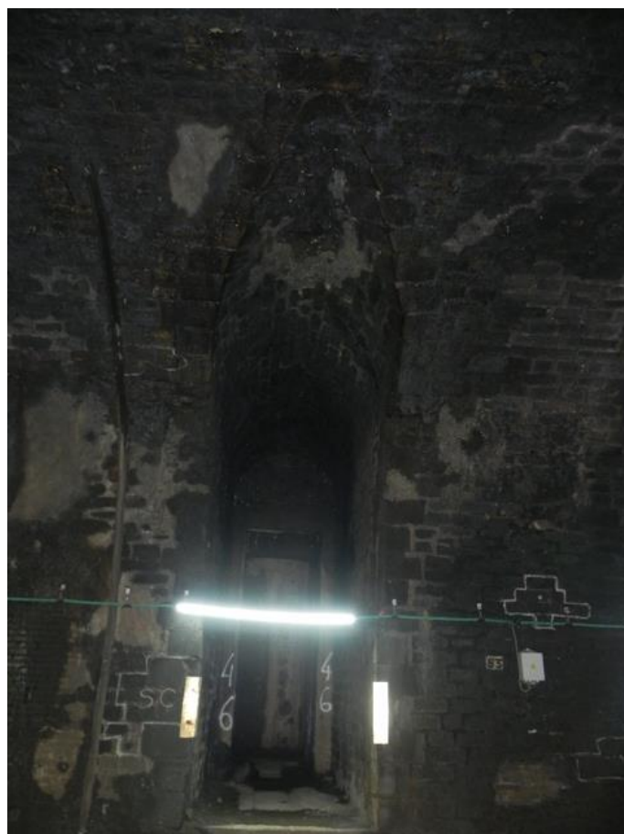
Accès à la cheminée d'aération du PM832 (26/03/2015)