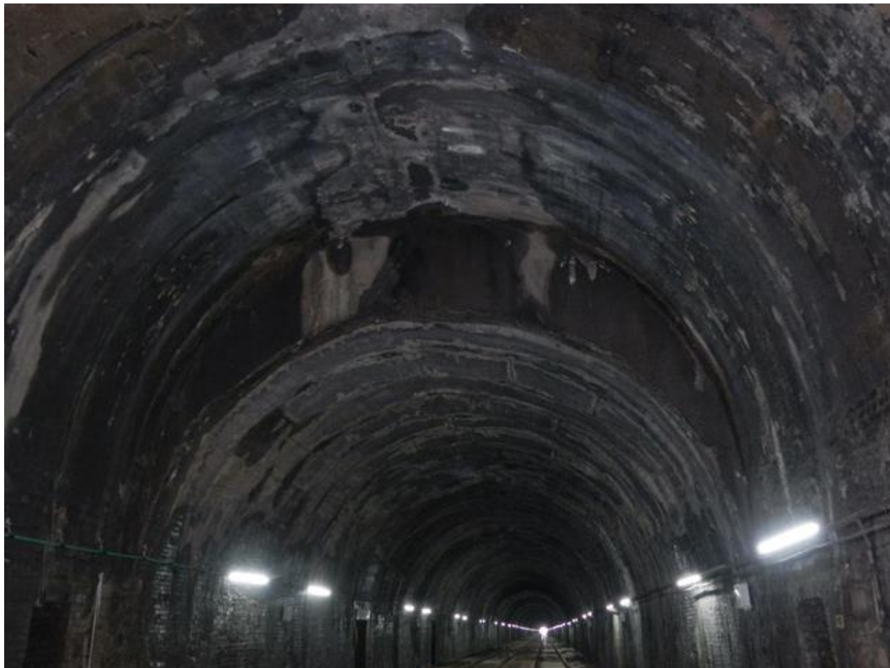
Un curieux changement de section sur 14 m avec une voûte plus haute (26/03/2015)