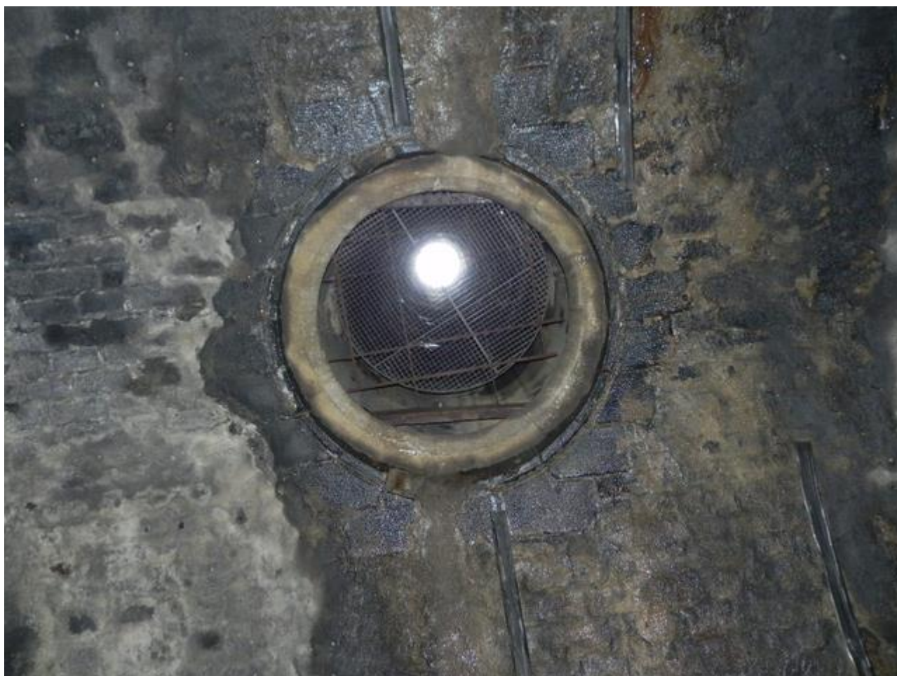
Cheminée en clé de voûte au PM 530 (26/03/2015)