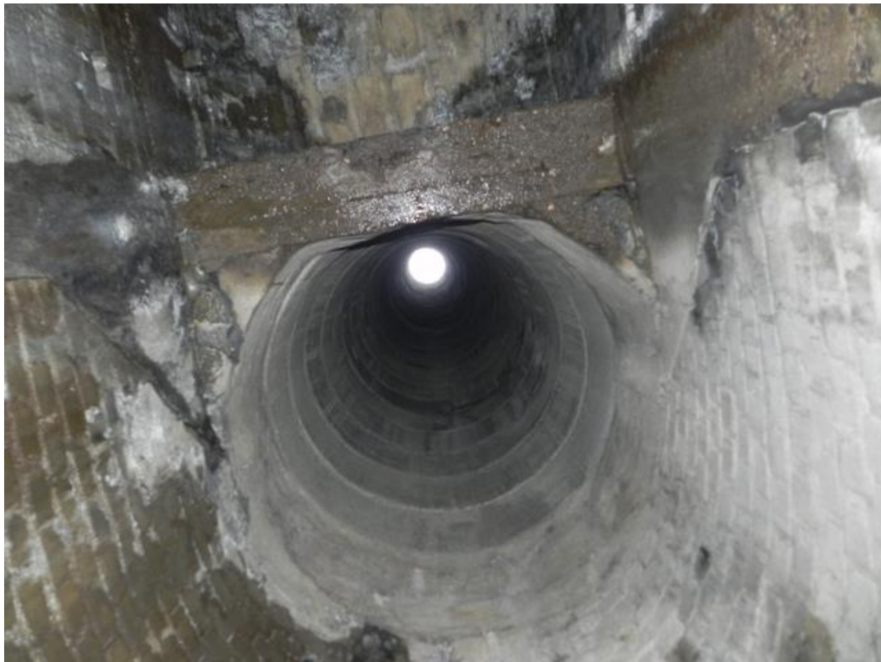
Et une autre sur le côté droit du tunnel au PM832 (26/03/2015)