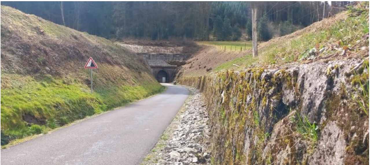
La sortie du tunnel après sa restauration et l'aménagement de la voie verte.