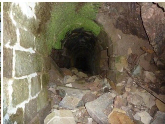
La galerie de gauche a beaucoup souffert.