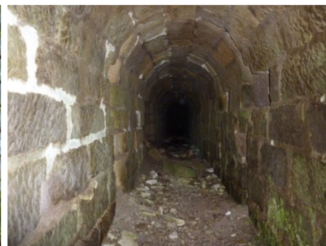
La galerie médiane