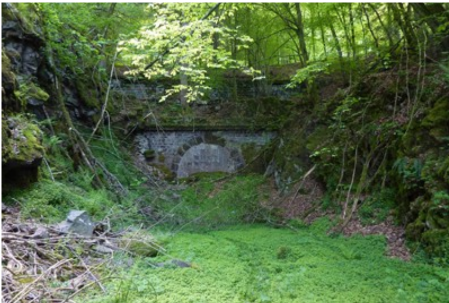
Ci-dessus, 3 photos de la sortie avant son aménagement