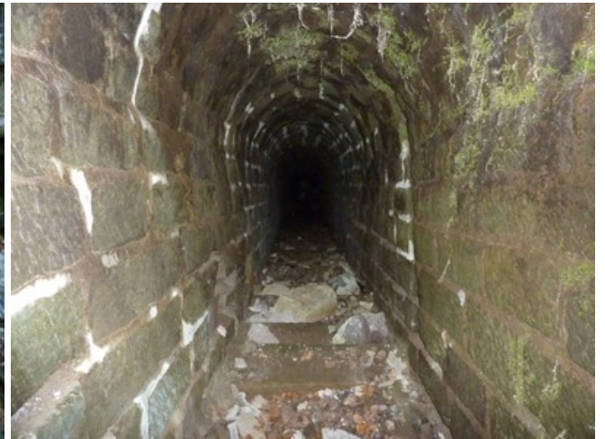
Ci-dessus et ci-dessous, l'escalier conduisant au fourneau de minage latéral droit.