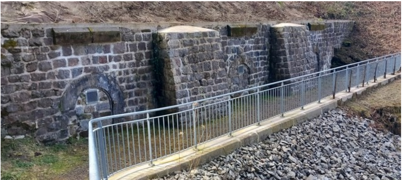
L'entrée des fourreaux de mines désormais condamnée.

Si cette fiche comporte des erreurs ou des oublis, merci de nous le signaler. Envoyez-nous vos photographies et documents pour la compléter.