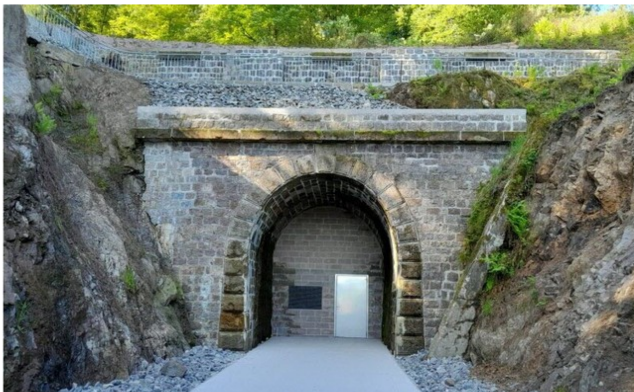
La sortie du tunnel après sa restauration et l'aménagement de la voie verte.