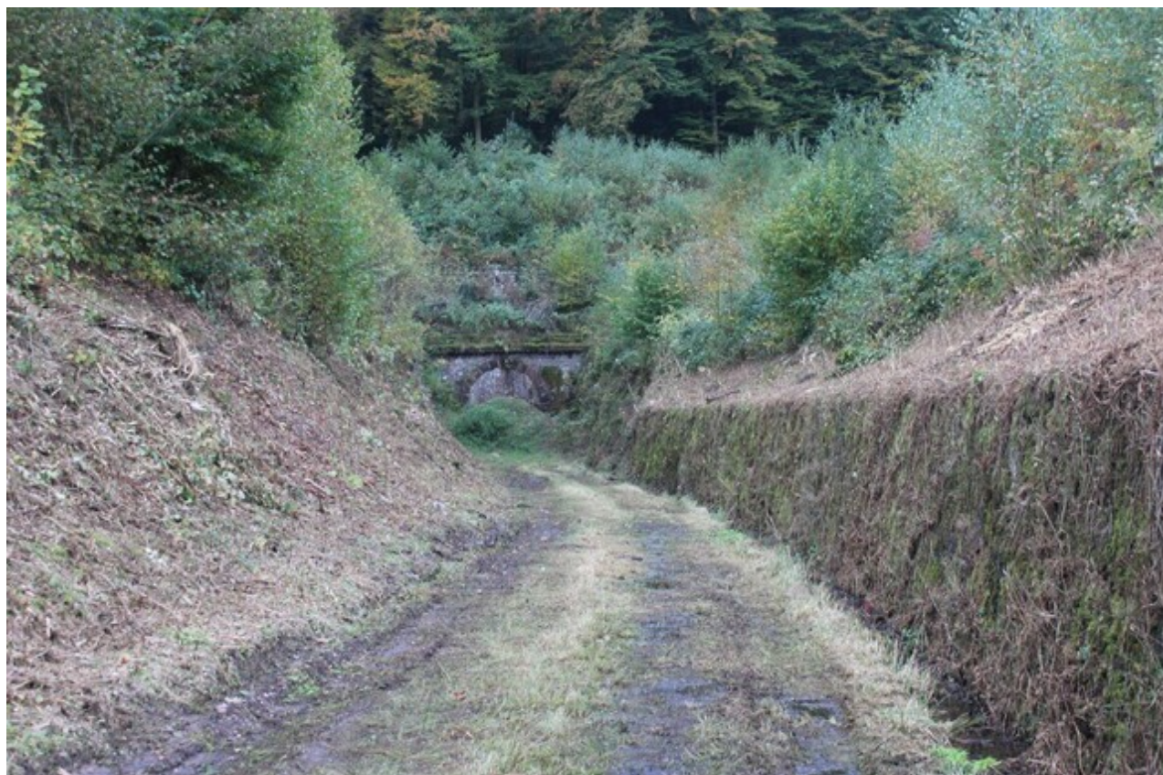
La sortie du tunnel en 2021, juste avant le début des travaux de restauration.