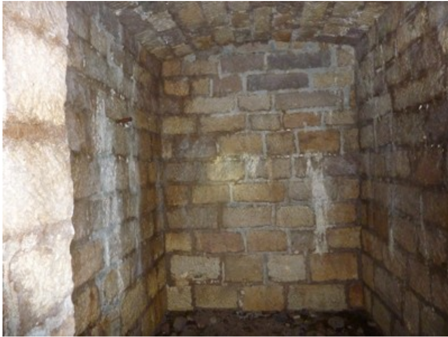
Fourreau de la voûte