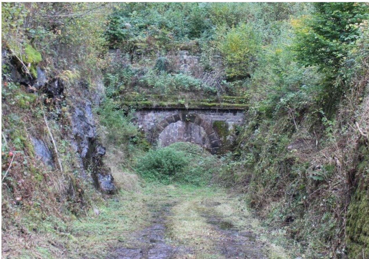
La sortie du tunnel en 2021, juste avant le début des travaux de restauration.