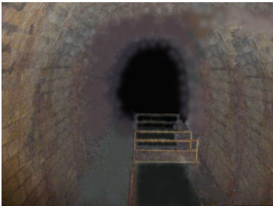
Photo montrant l'intérieur du tunnel et les aménagements de captage et stockage des eaux.