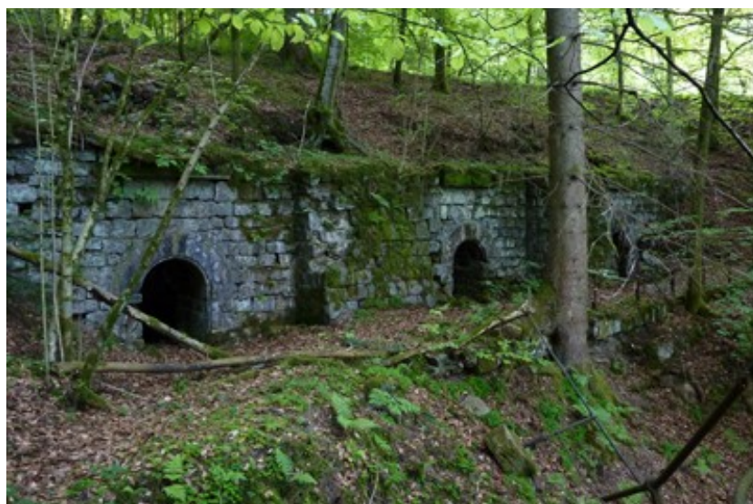
Les entrées des trois galeries de dynamitage au-dessus du fronton de sortie du tunnel.