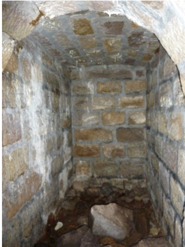
Le fourneau latéral droit