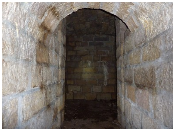
Située au-dessus de la voûte du tunnel, la galerie médiane est plane et conduit au fourneau de la voûte.