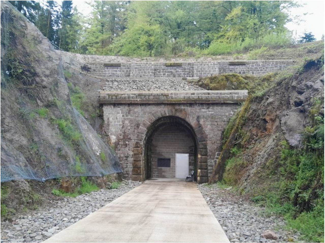
La sortie du tunnel après sa restauration et l'aménagement de la voie verte.