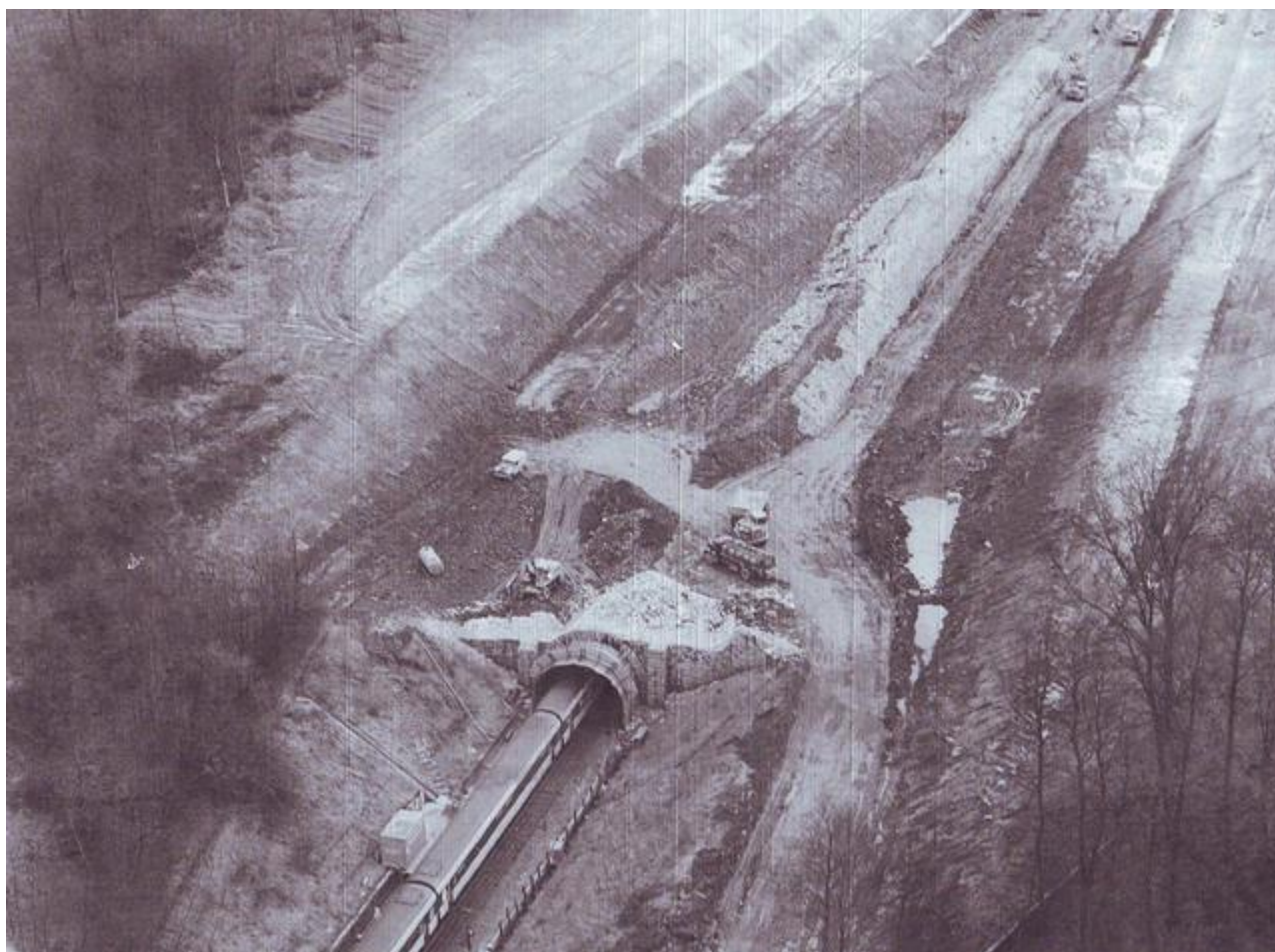
Vue aérienne lors des travaux de mise à ciel ouvert du tunnel

Si cette fiche comporte des erreurs ou des oublis, merci de nous le signaler.