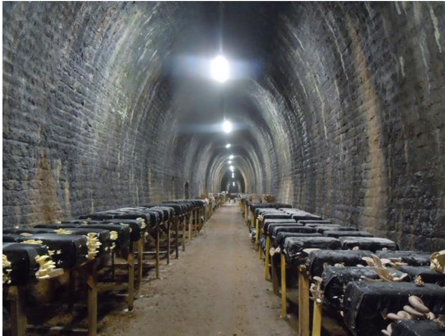
La champignonnière installée depuis 2018 dans le tunnel (29/08/2022)

Si cette fiche comporte des erreurs ou des oublis, merci de nous le signaler.