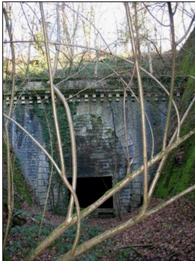
Entrée dans son état actuel