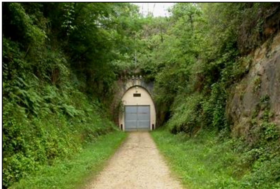
INTERIEUR DU TUNNEL