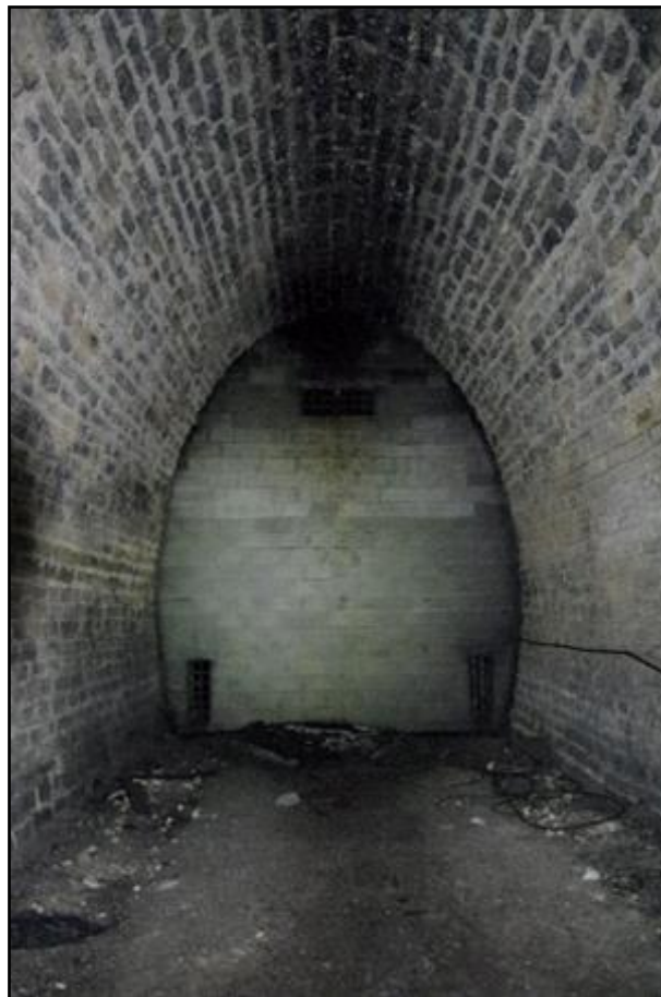
La cloison intermédiaire qui ferme le fond de la cave vinicole vue ici depuis la partie de galerie inutilisée et abandonnée