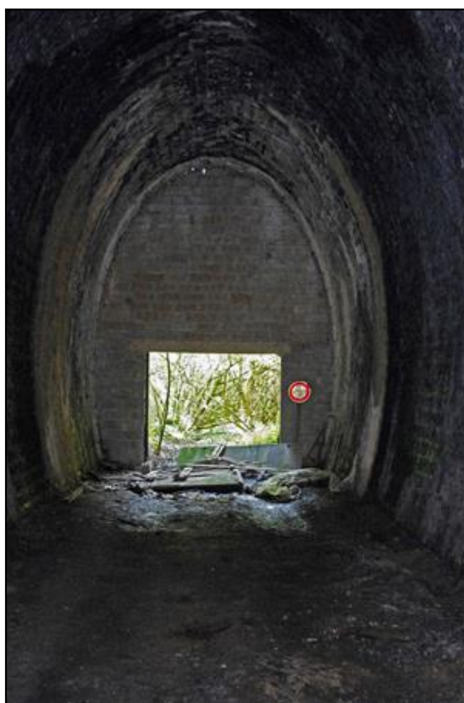
Entrée vue de l'intérieur dans son état actuel