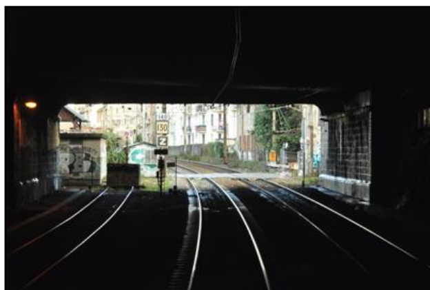
L'intérieur de la galerie A gauche, en regardant vers l'entrée ; à droite, en regardant vers la sortie

Si cette fiche comporte des erreurs ou des oublis, merci de nous le signaler.