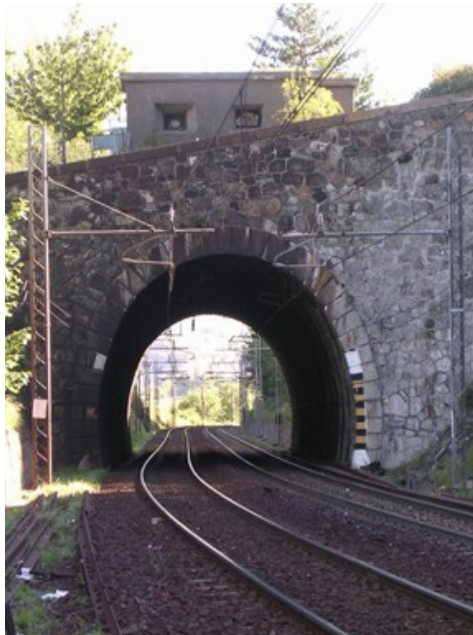
Le tunnel surmonté de sa casemate de défense dont les fenêtres de tir sont bien visibles.