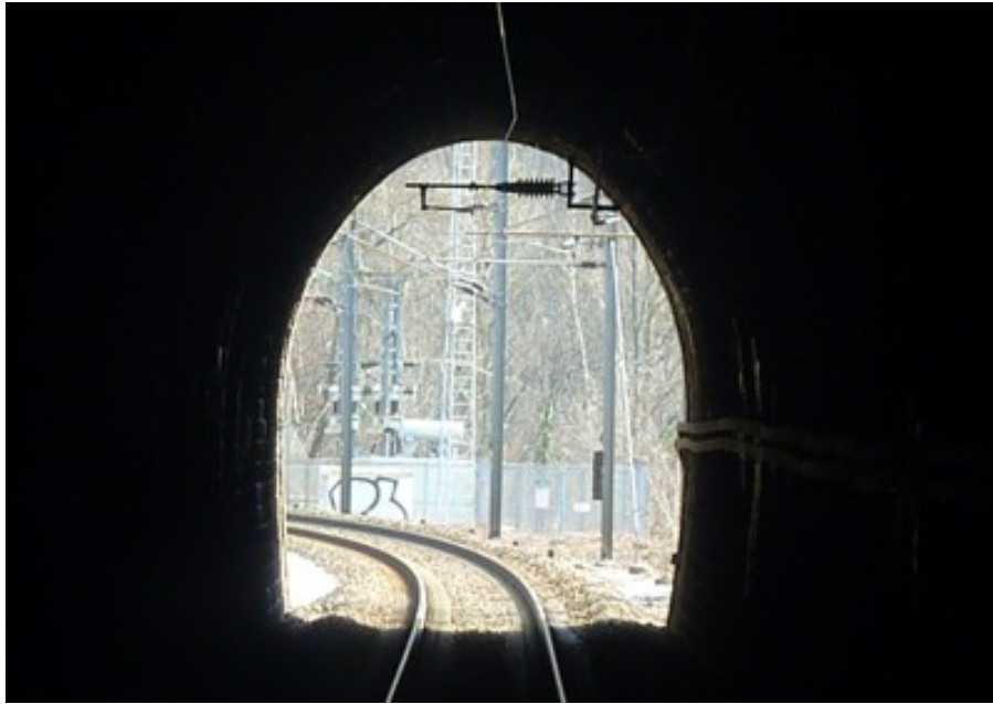
Vue vers la sortie

Si cette fiche comporte des erreurs ou des oublis, merci de nous le signaler. Envoyez-nous vos photographies et documents pour la compléter.