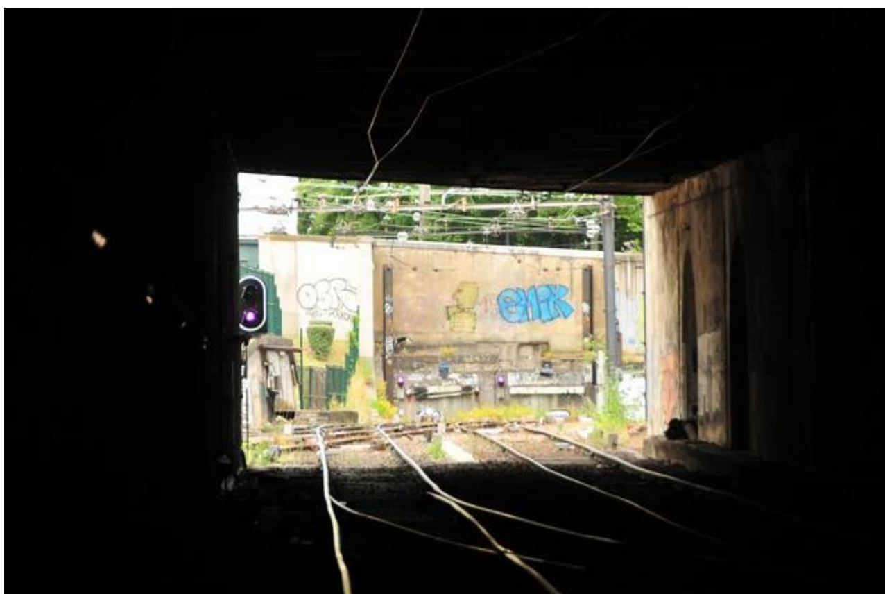
Vue de la sortie depuis l'intérieur de la galerie

Si cette fiche comporte des erreurs ou des oublis, merci de nous le signaler.