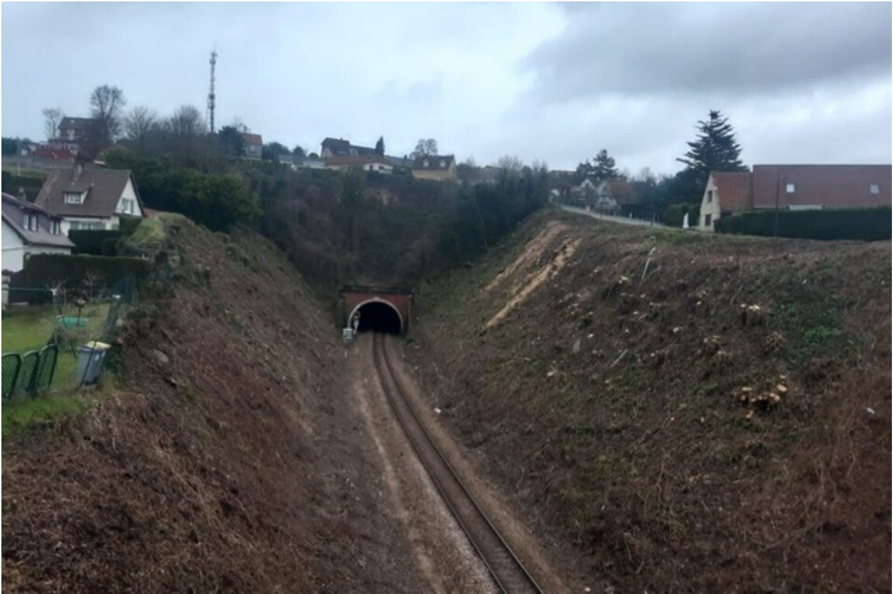
La tranchée de l'entrée, après déboisement en décembre 2023