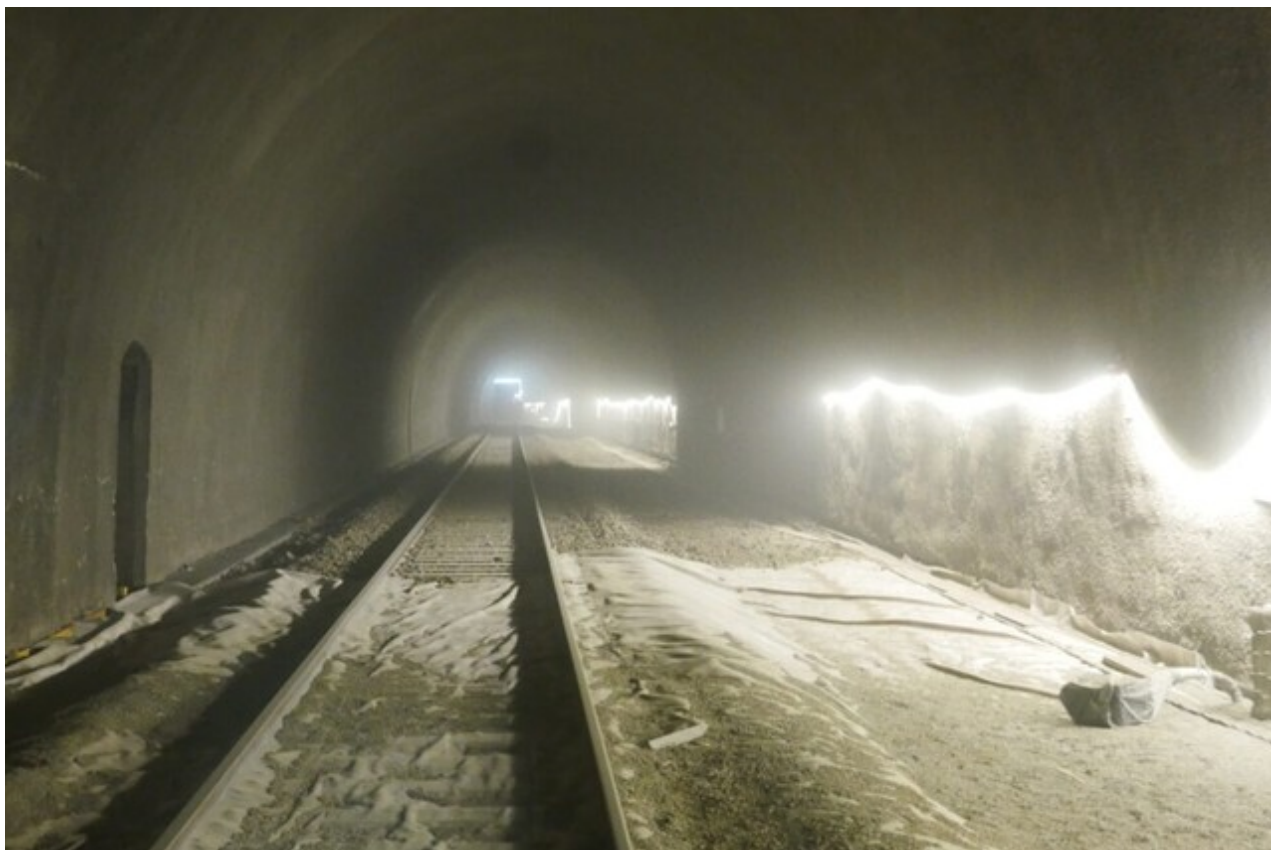
L'intérieur du tunnel lors des travaux de rénovation pendant l'hiver 2023/2024

Si cette fiche comporte des erreurs ou des oublis, merci de nous le signaler. Envoyez-nous vos photographies et documents pour la compléter.