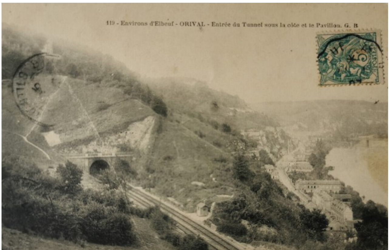
Ci-dessus, deux vues anciennes de l'entrée du tunnel