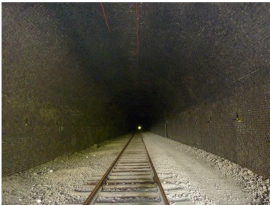
Intérieur du tunnel depuis la sortie

Si cette fiche comporte des erreurs ou des oublis, merci de nous le signaler. Envoyez-nous vos photographies et documents pour la compléter.