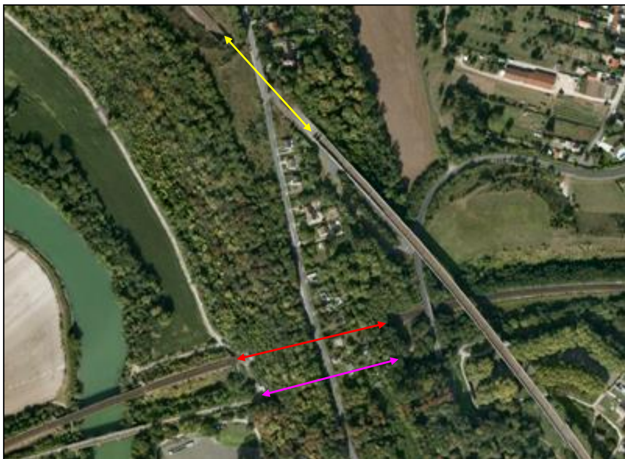
Vue aérienne des trois tunnels de Chalifert

Double flèche jaune : Chalifert LGV Double flèche rouge : Chalifert actuel Double flèche violette : Chalifert Ancien