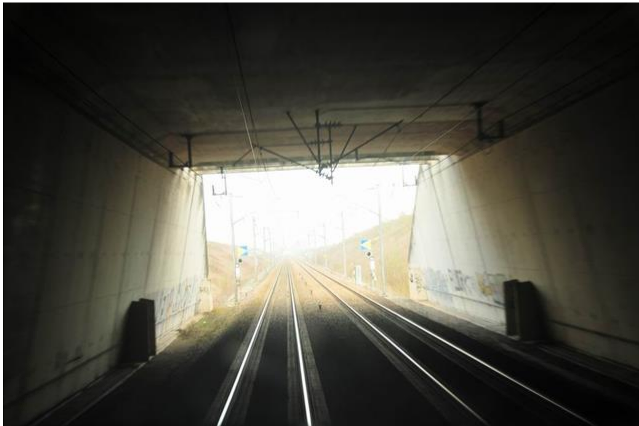
Vue en direction de la sortie (31/03/2014)