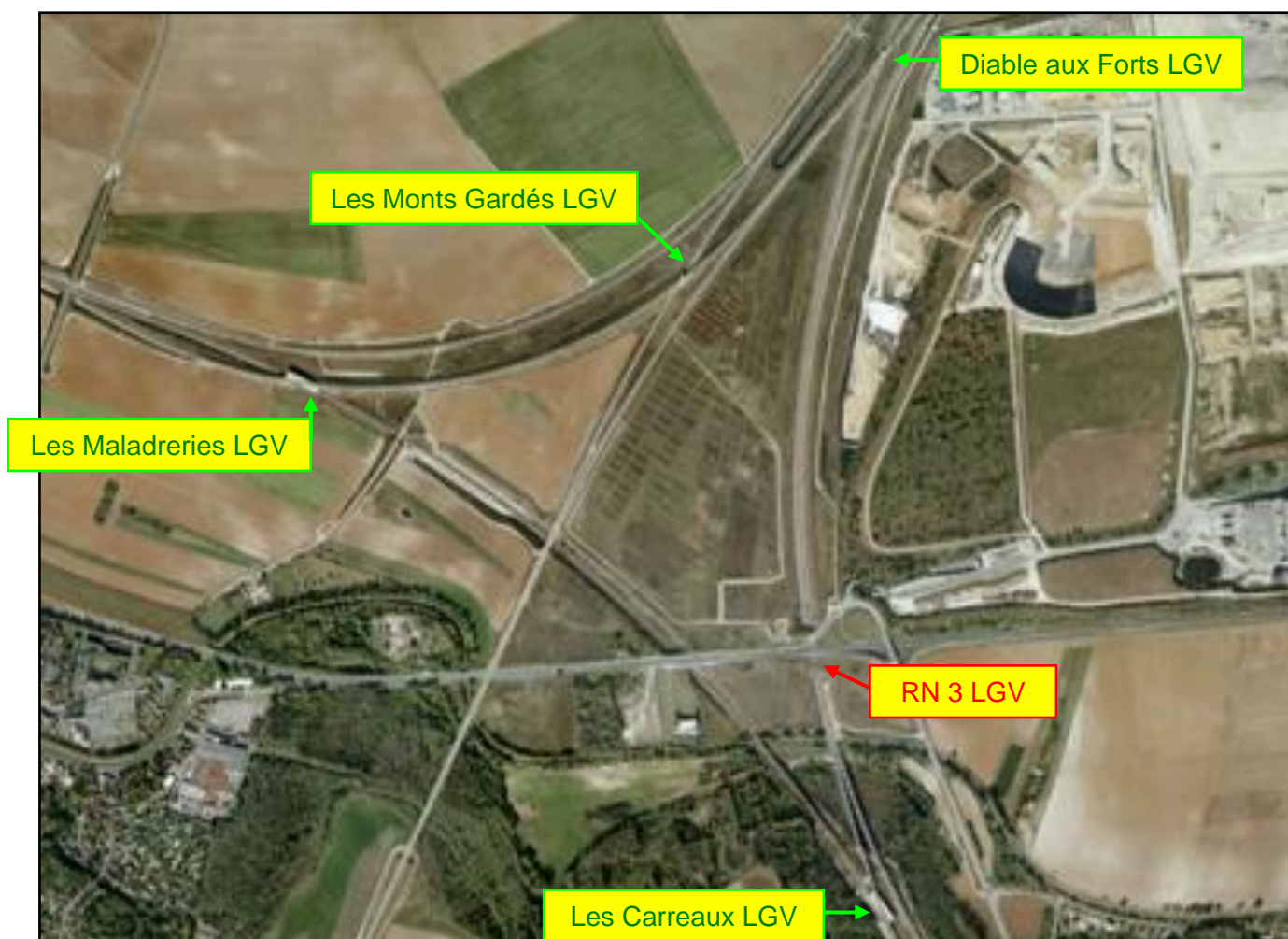
Vue aérienne globale du nœud LGV des Monts Gardés et de ses galeries