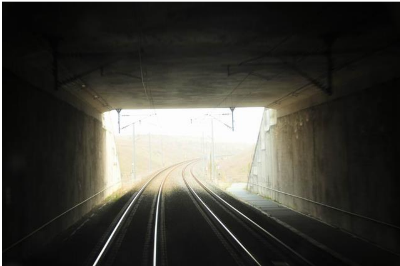
Vue de l'intérieur vers la sortie

Si cette fiche comporte des erreurs ou des oublis, merci de nous le signaler.