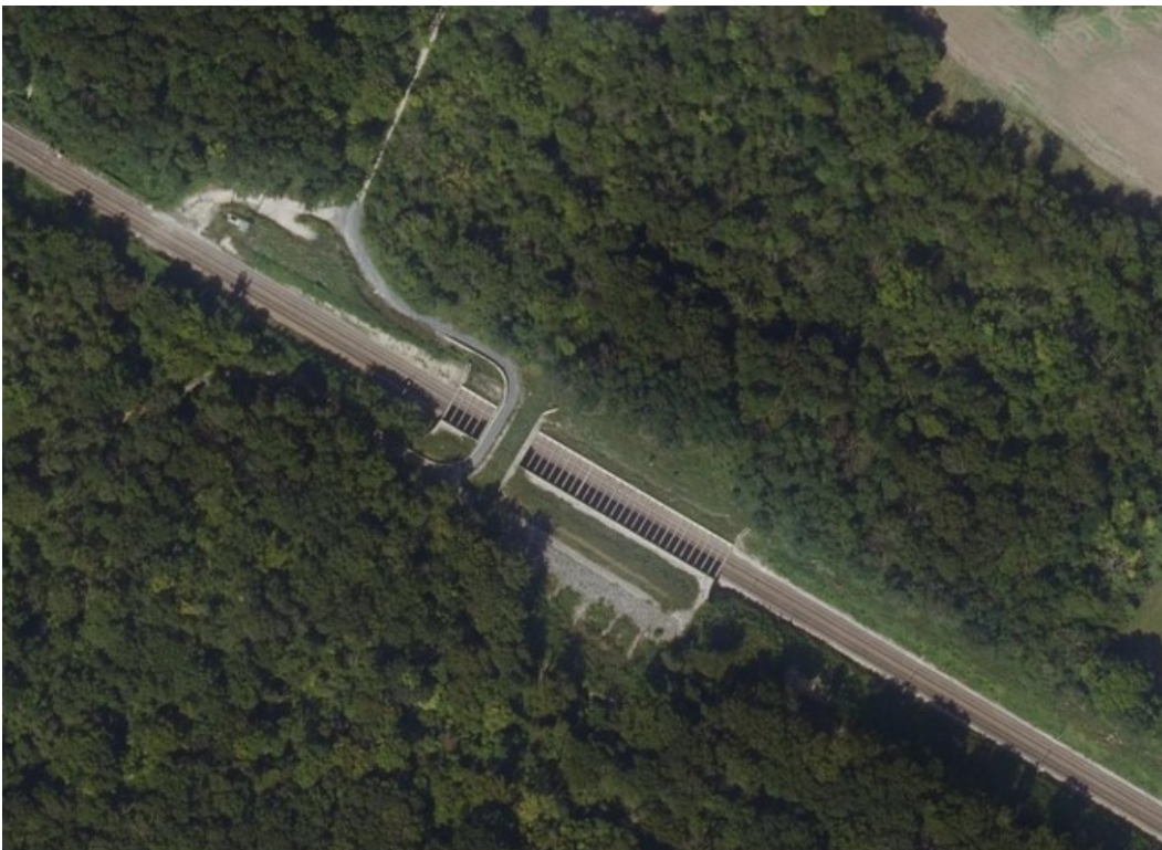
Vue aérienne du tunnel après sa transformation en tranchée couverte