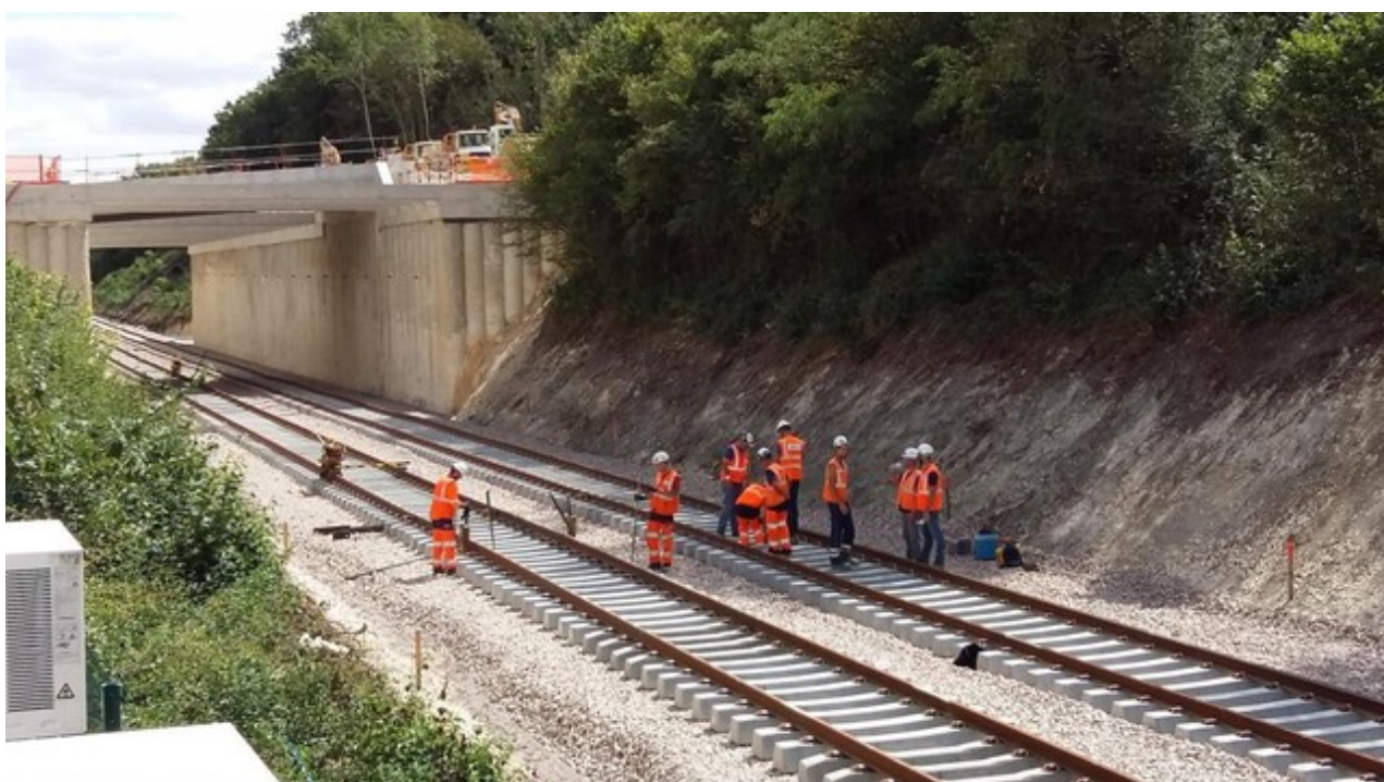
La tranchée couverte après démolition du tunnel, lors de la repose de la voie ferrée

Si cette fiche comporte des erreurs ou des oublis, merci de nous le signaler. Envoyez-nous vos photographies et documents pour la compléter.