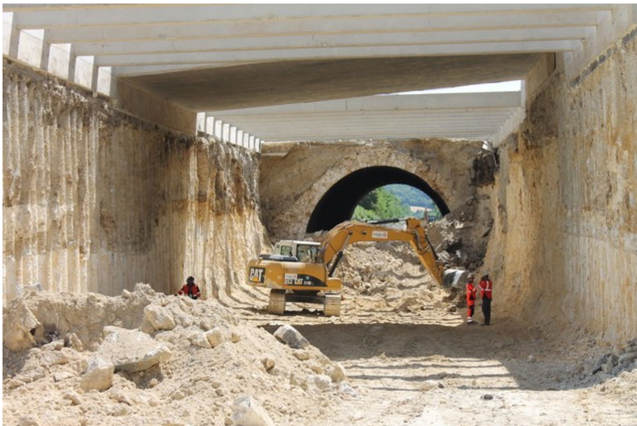
Le tunnel lors de sa démolition dans le courant de l'été 2019