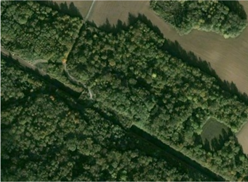
Vue aérienne du tunnel avant sa démolition

Cette tranchée couverte a été démolie lors de l'été 2019 dans le cadre de l'électrification de la ligne jusqu'à Troyes. N'étant pas adapté au gabarit nécessaire, le tunnel a été remplacé par une tranchée couverte. Un pont a été construit pour rétablir un chemin rural et un passage spécifique dédié à la faune.