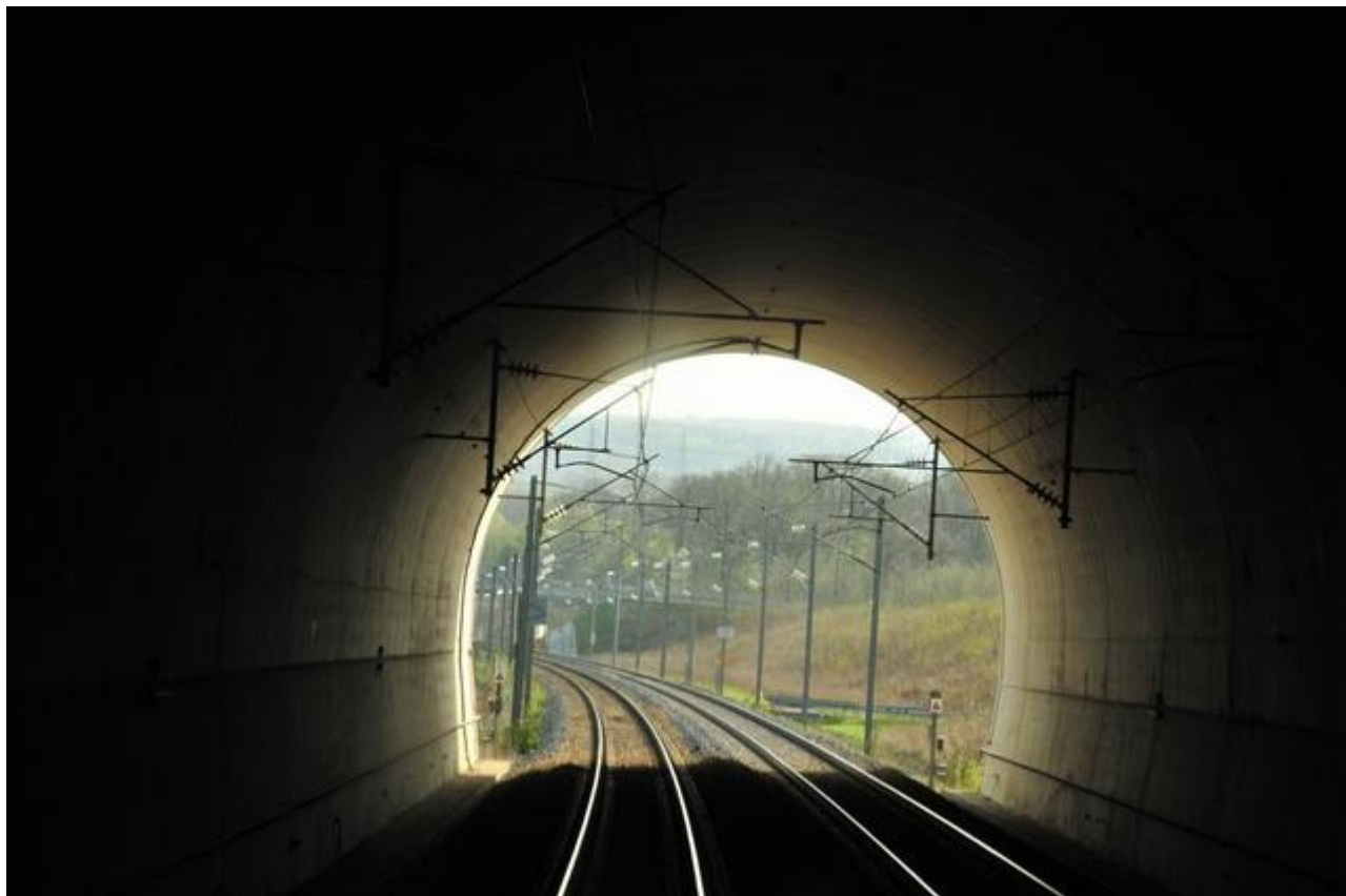
Vue vers l'entrée