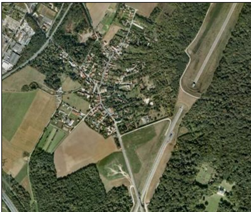
Vue aérienne de la galerie