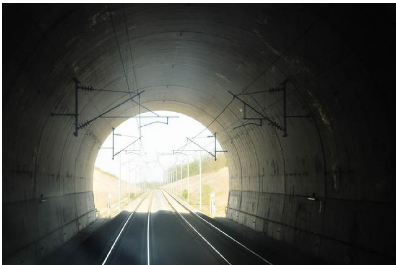
Vue vers la sortie