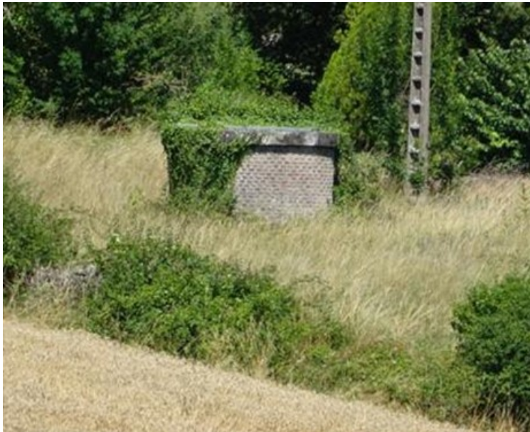
La seconde cheminée d'aération (PM 941)

Si cette fiche comporte des erreurs ou des oublis, merci de nous le signaler. Envoyez-nous vos photographies et documents pour la compléter.