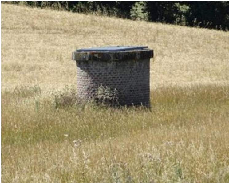
La première cheminée d'aération (PM 522)