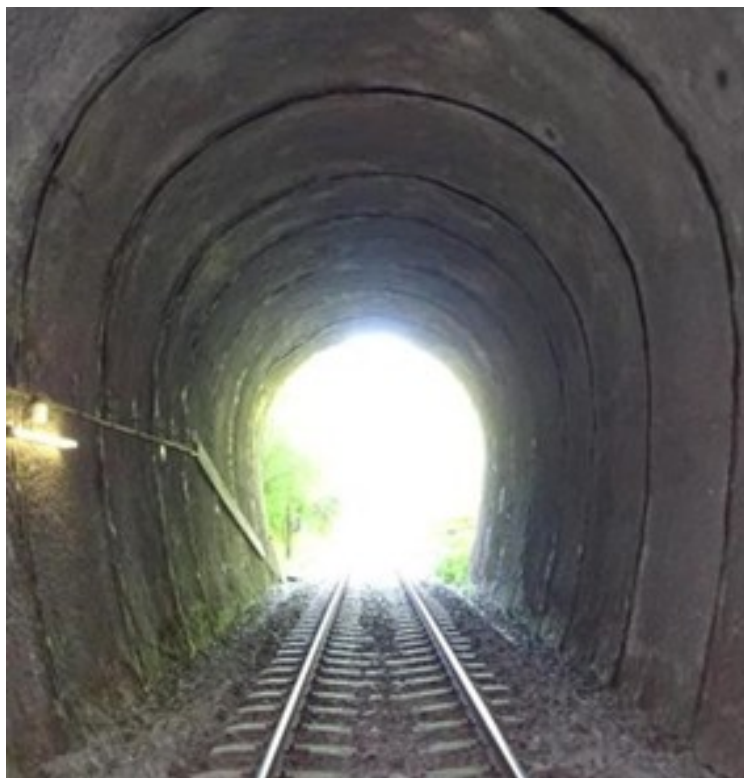
Vue vers l'entrée