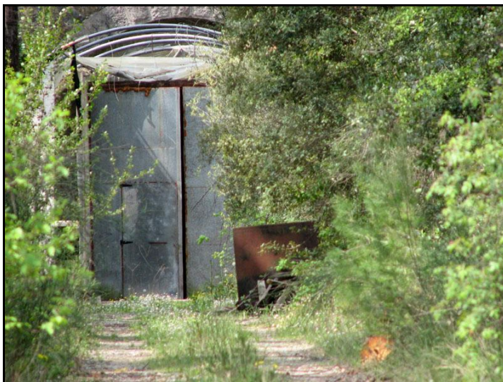
La sortie du tunnel au temps de la champignonnière

Si cette fiche comporte des erreurs ou des oublis, merci de nous le signaler.