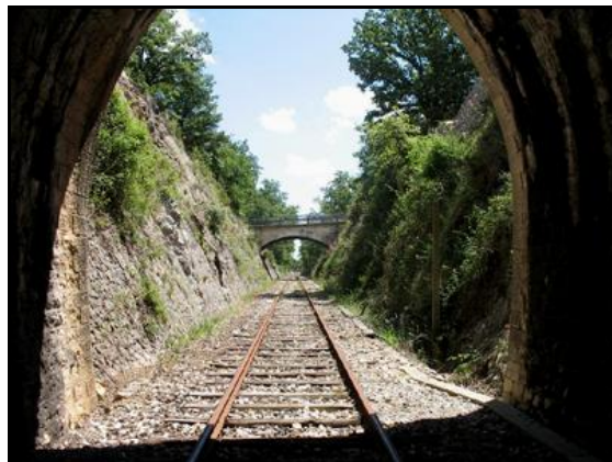
Vue de la sortie depuis l'intérieur

Si cette fiche comporte des erreurs ou des oublis, merci de nous le signaler.