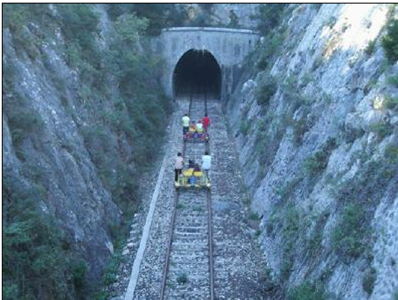
La sortie du tunnel dans son usage actuel