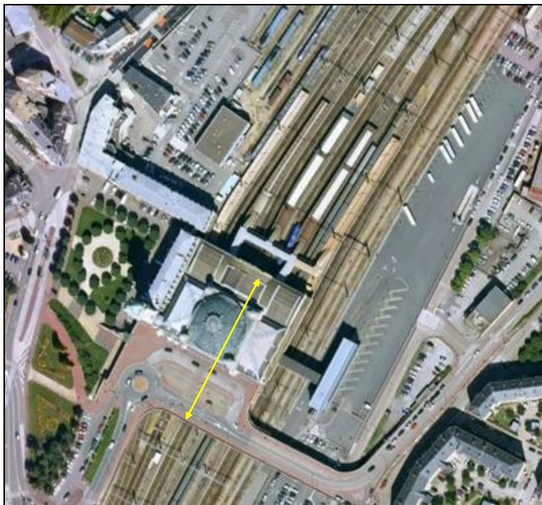
Vue aérienne de la galerie de la gare

Si cette fiche comporte des erreurs ou des oublis, merci de nous le signaler.