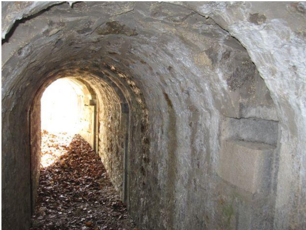
Détail du couloir qui pouvait visiblement être obturé en plusieurs tronçon, probablement pour augmenter la puissance de feu...

Si cette fiche comporte des erreurs ou des oublis, merci de nous le signaler.