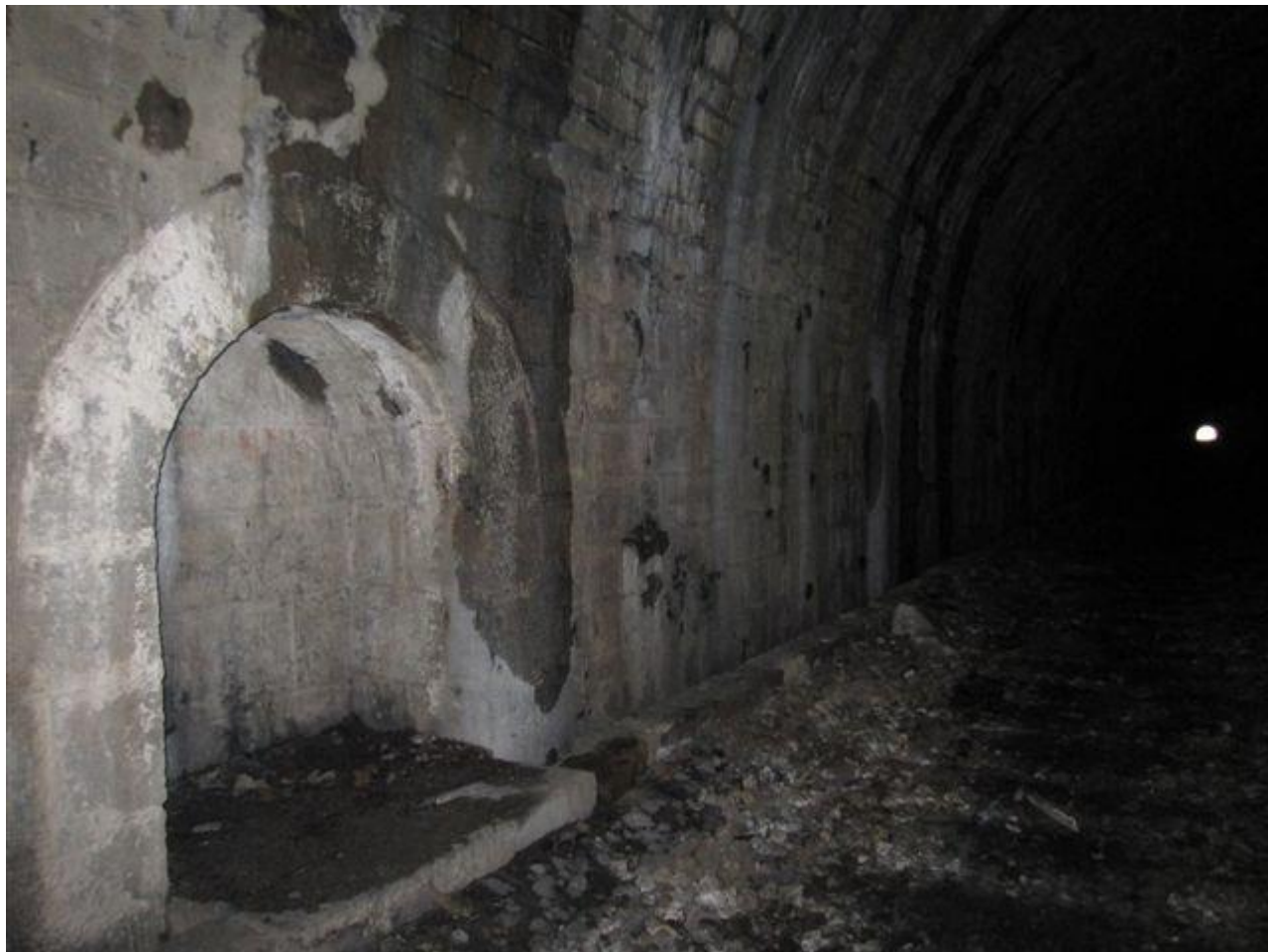
Détail d'une niche (22/03/2011)