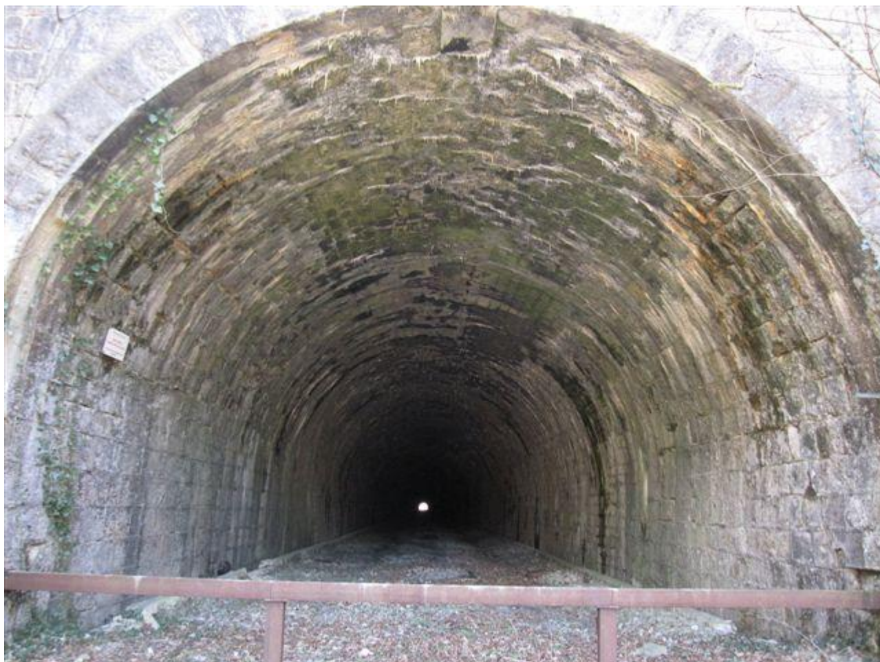
La galerie du tunnel vue depuis l'entrée (22/03/2011)