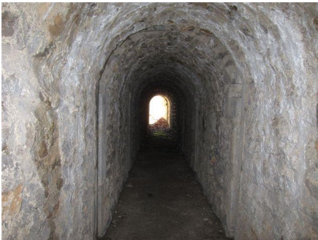
Depuis le fond du couloir vers la sortie