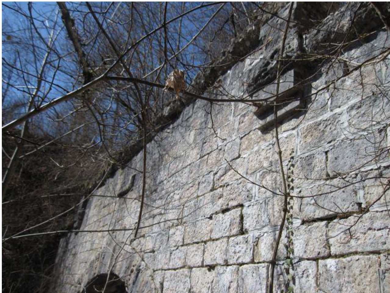
Le fronton de sortie, avec l'inscription 1880 dans un cartouche (22/03/2011)