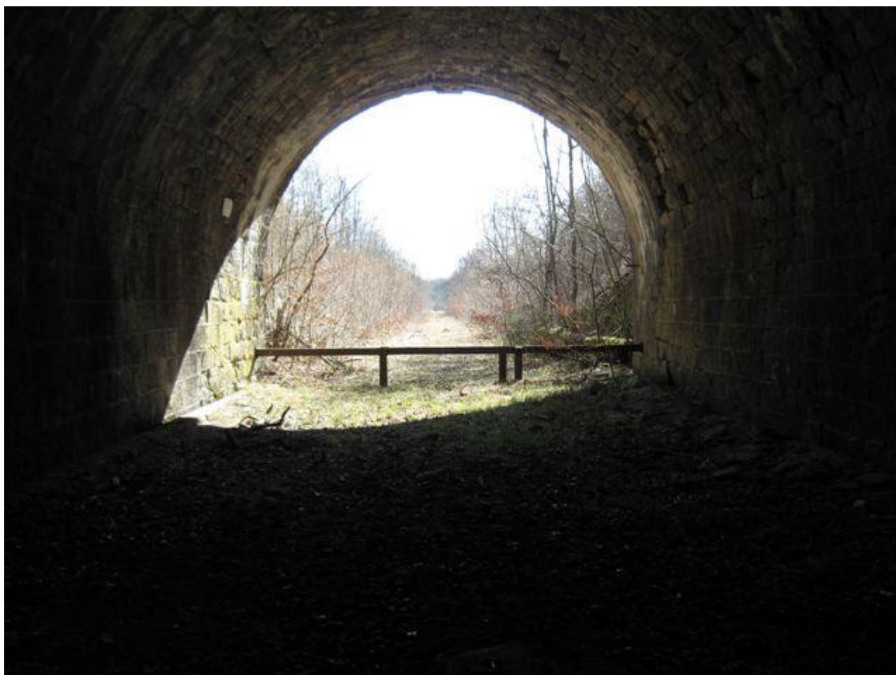
La sortie depuis l'intérieur du tunnel