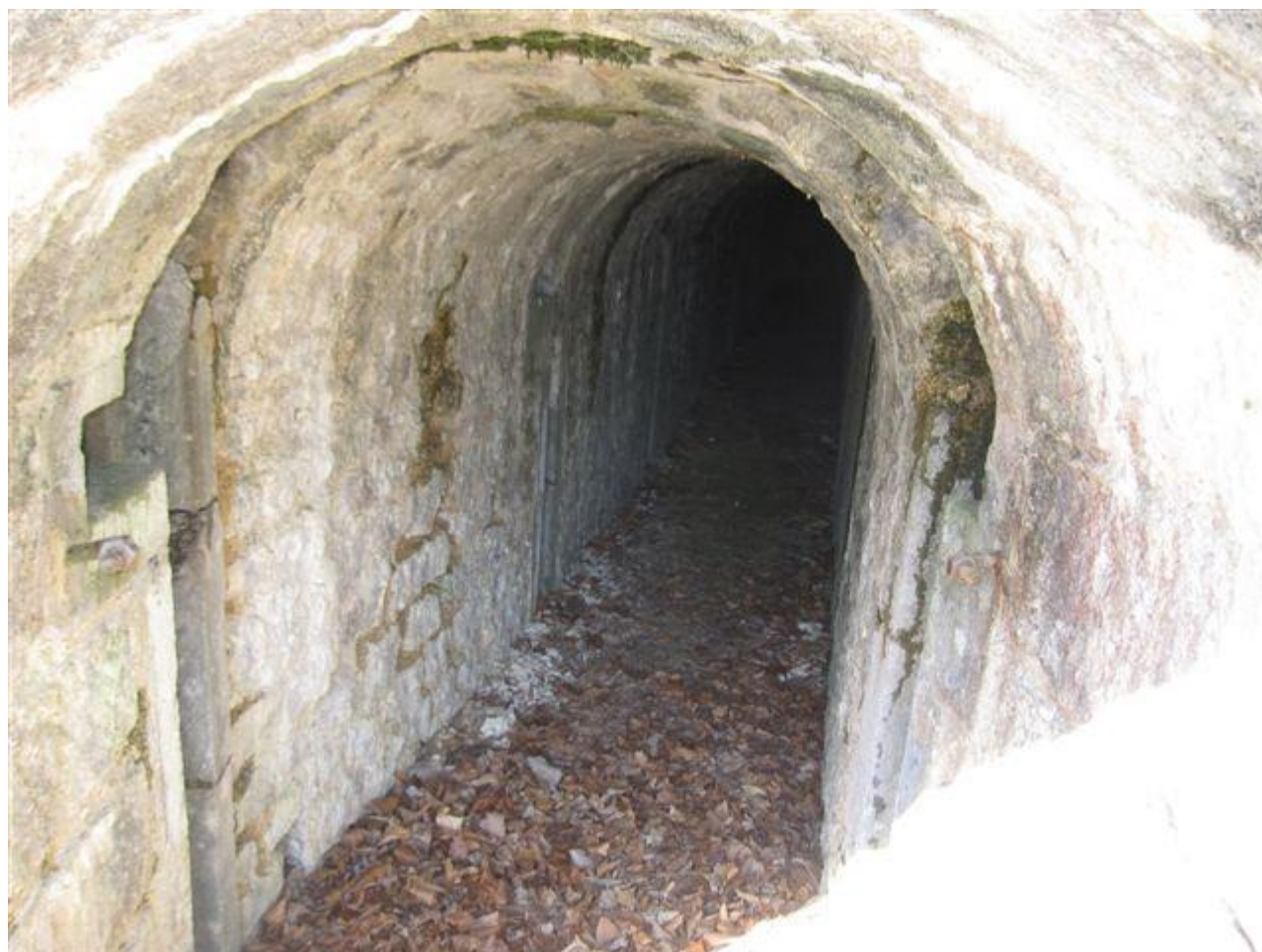
Entrée de la chambre à mines, du côté gauche du tunnel depuis l'entrée (22/03/2011)