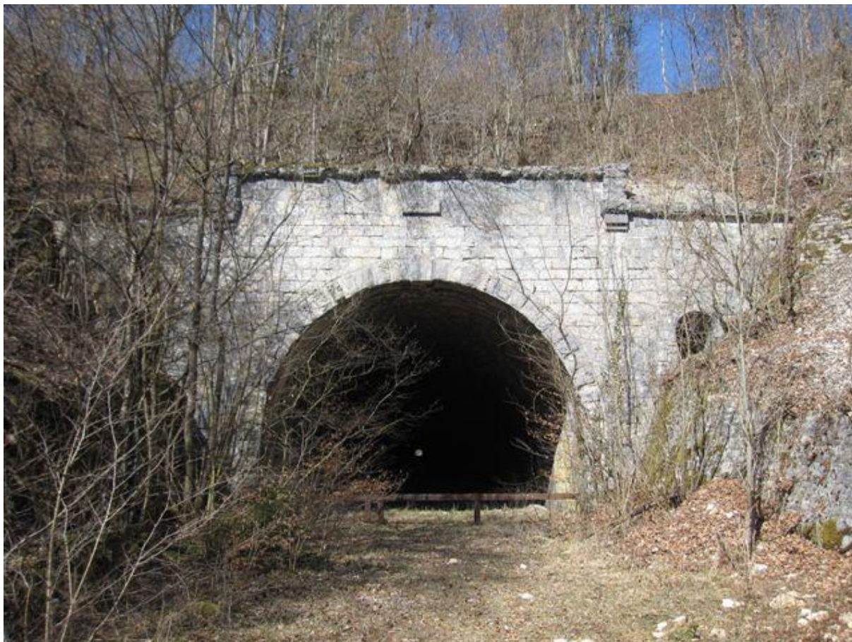
On distingue de chaque côté l'accès aux chambres de mines, en surélévation par rapport à la plateforme (22/03/2011)