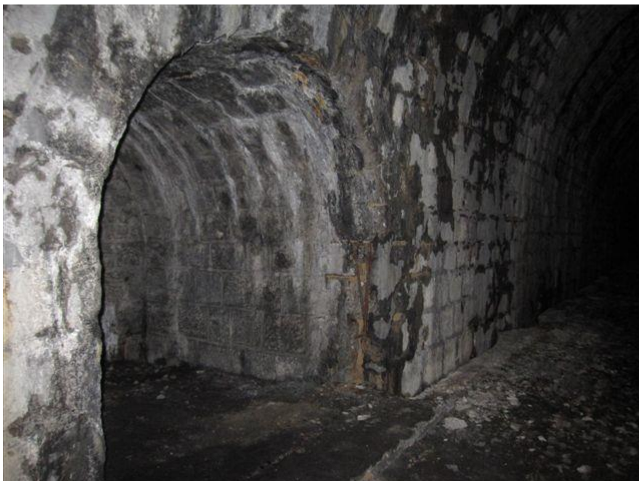
Détail d'une niche de grandes dimensions (22/03/2011)