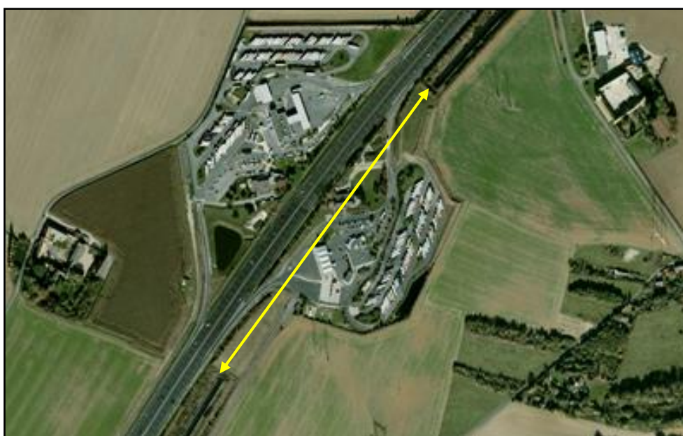
Vue aérienne de la galerie sous l'aire d'autoroute