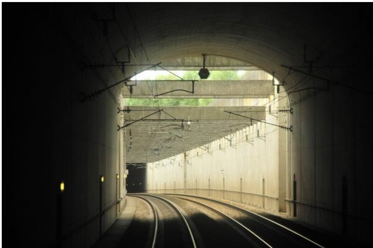
La sortie vue depuis la galerie

Si cette fiche comporte des erreurs ou des oublis, merci de nous le signaler.