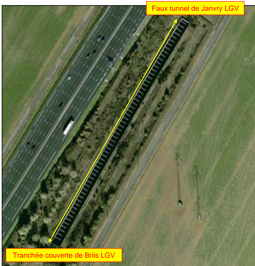
Détail de la tranchée en encoffrement

Faux tunnel construit sous une aire de repos de l'autoroute A 10. Il est séparé de la tranchée couverte de Briis sous Forges par une tranchée semi-couverte en encoffrement.