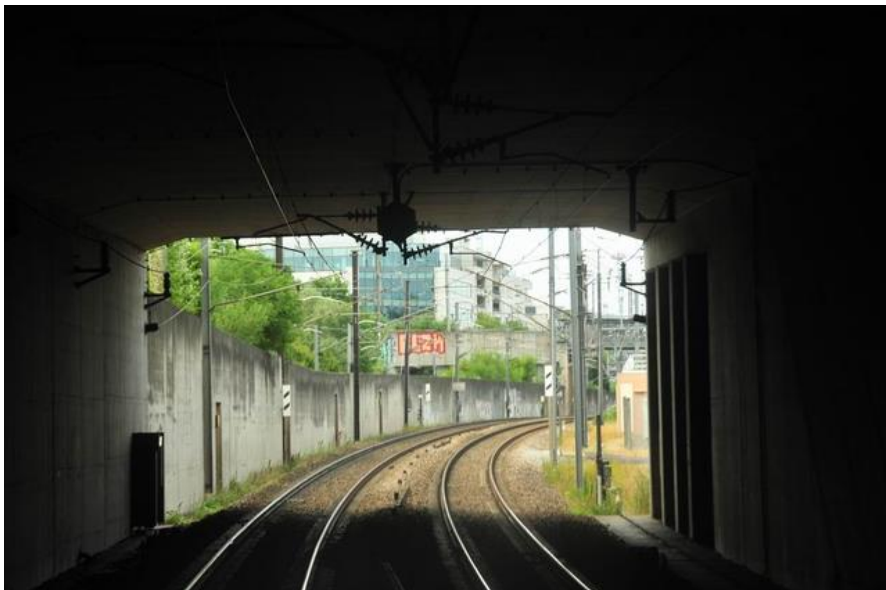
La sortie vue de l'intérieur de la galerie

Si cette fiche comporte des erreurs ou des oublis, merci de nous le signaler.