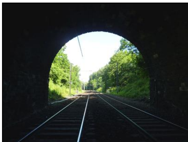
L'entrée et la sortie vues de l'intérieur