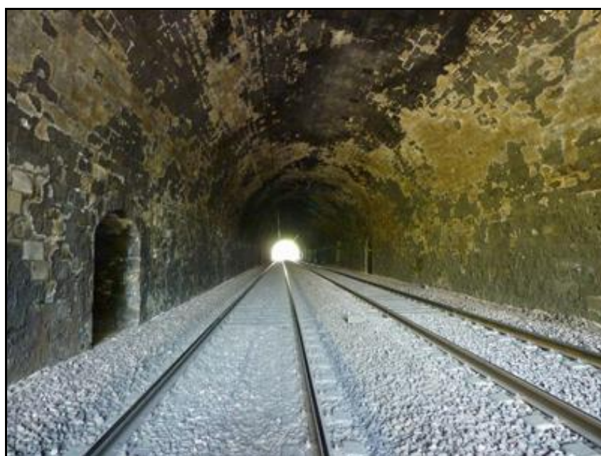
Ci-dessus et ci-dessous, deux vues de la superbe galerie du tunnel Noter sur la voûte, les traces persistantes de suie datant de la traction vapeur