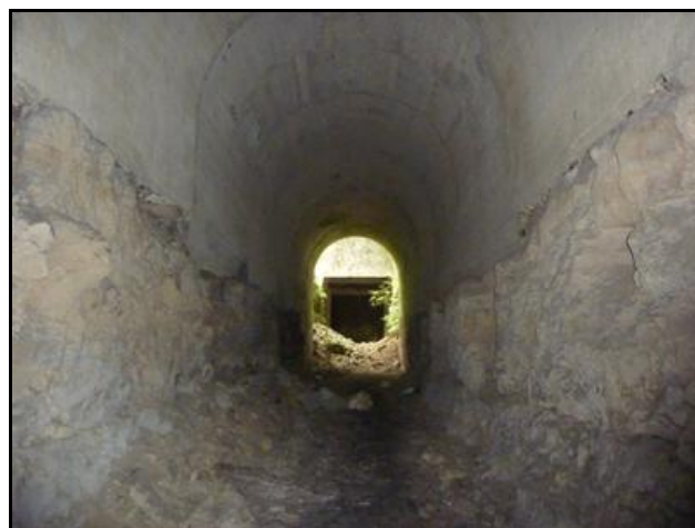
Au fond, l'entrée blindée du tunnel de Hennocque 2

Si cette fiche comporte des erreurs ou des oublis, merci de nous le signaler.