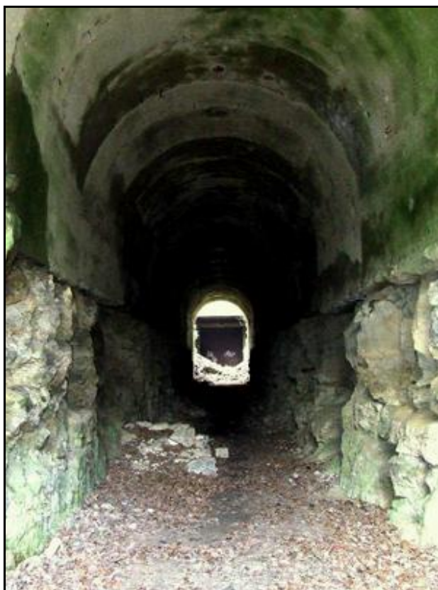
Ci-dessus et ci-dessous, trois aspects de la galerie du tunnel