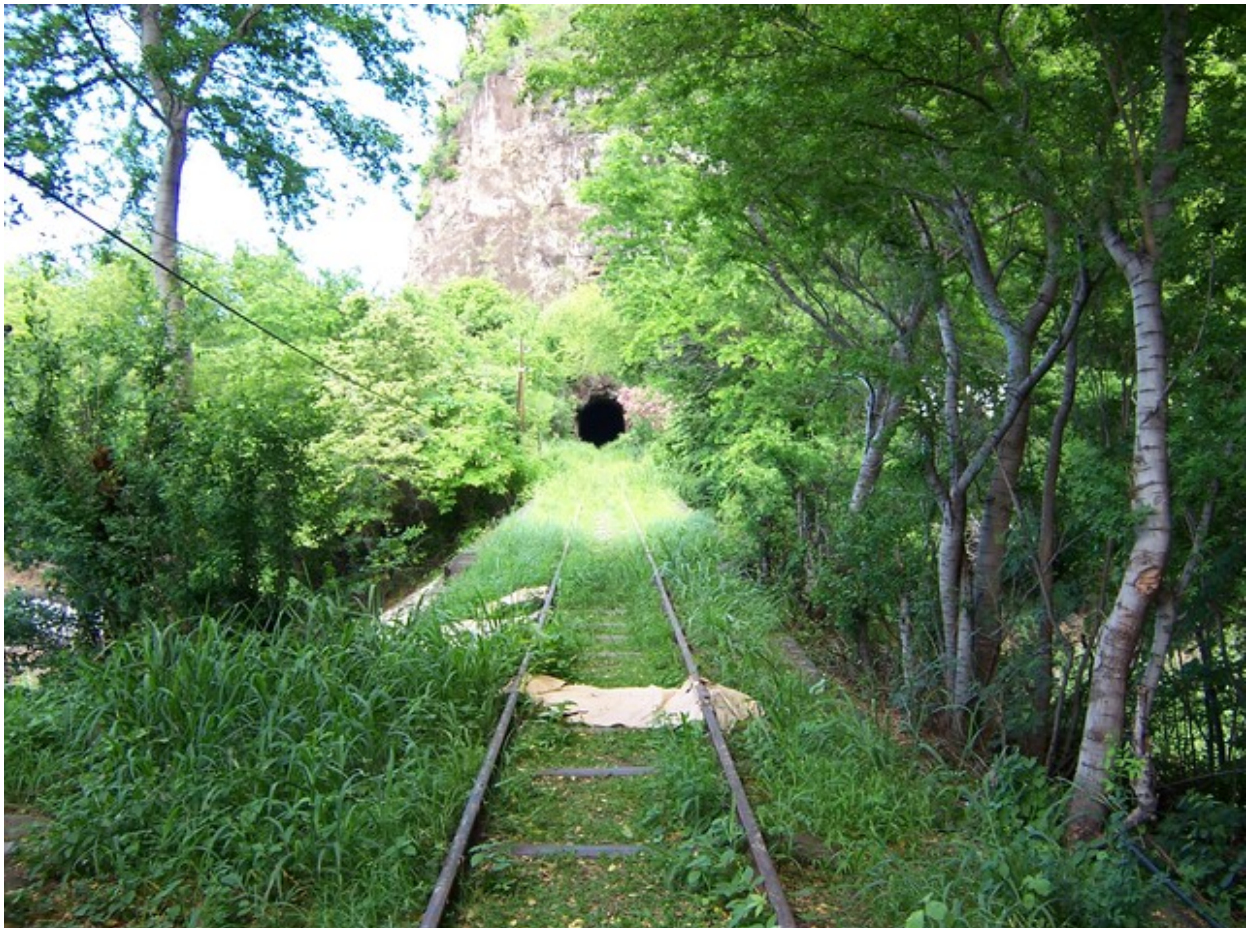
La sortie du tunnel, avec la voie toujours présente mais qui s'arrête quelques mètres plus loin (15/01/2005)