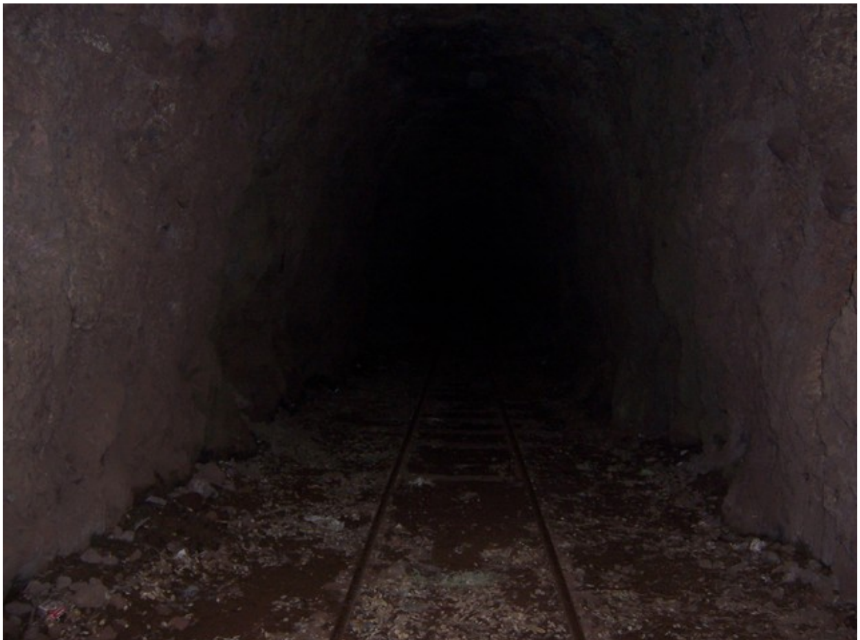
Vue de la galerie près de l'entrée (27/02/2005)