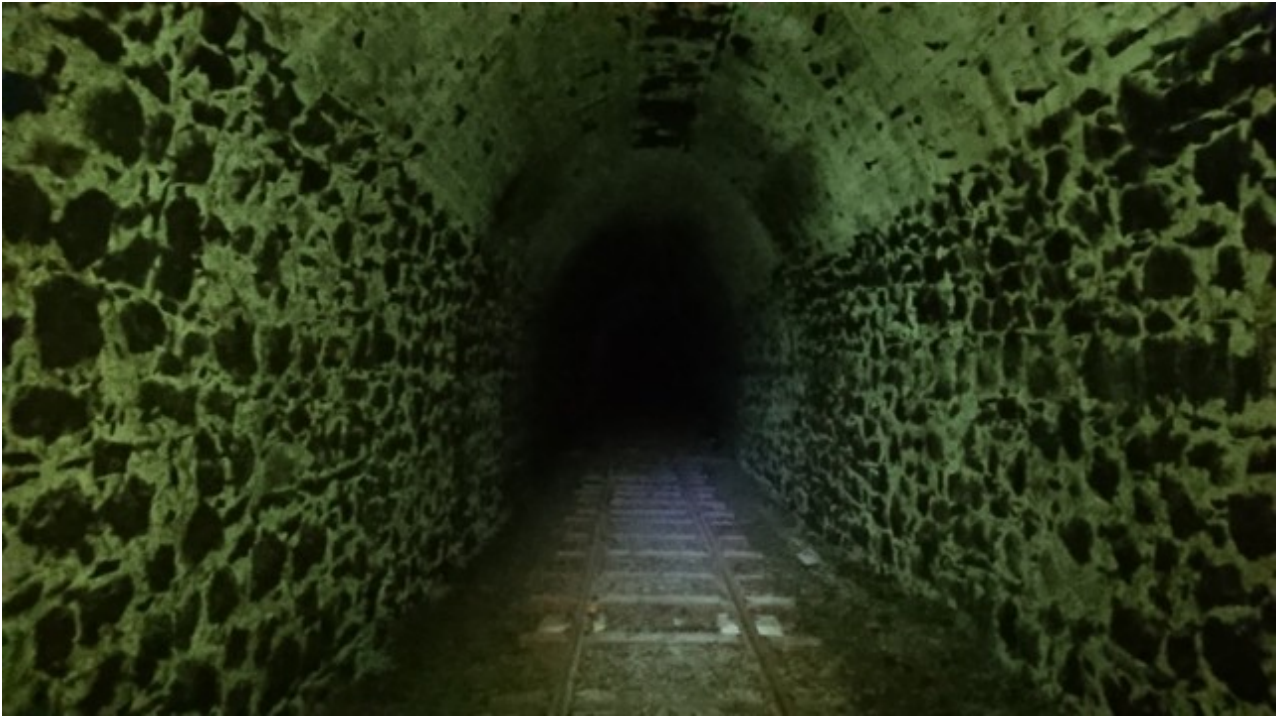
Galerie maçonnée (2019)