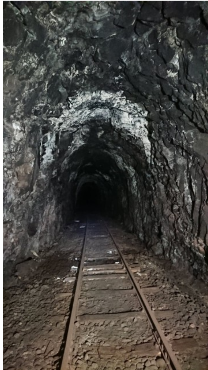
Galerie à l'état brut (2019)