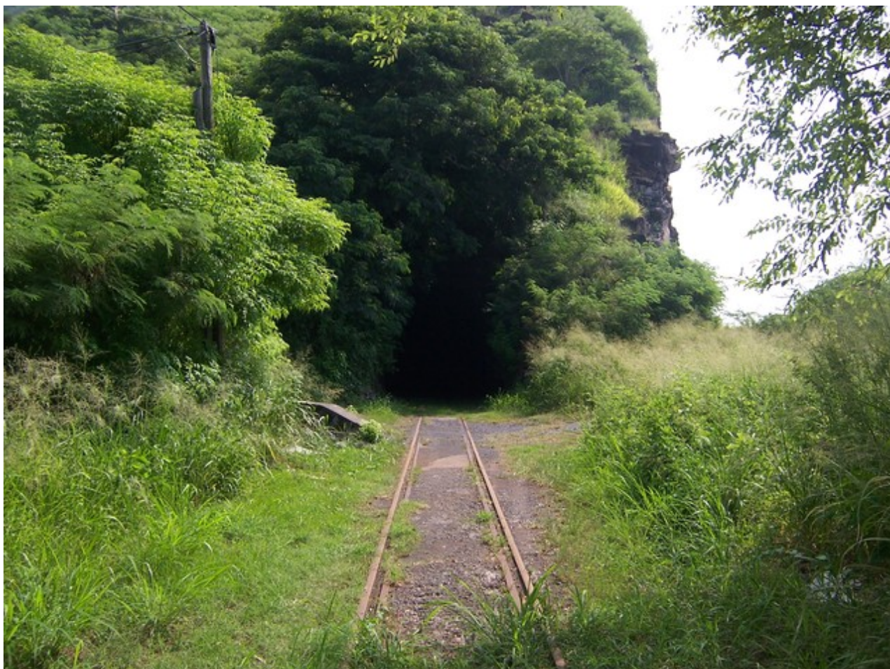
L'entrée du tunnel, avec la voie toujours présente (27/02/2005)