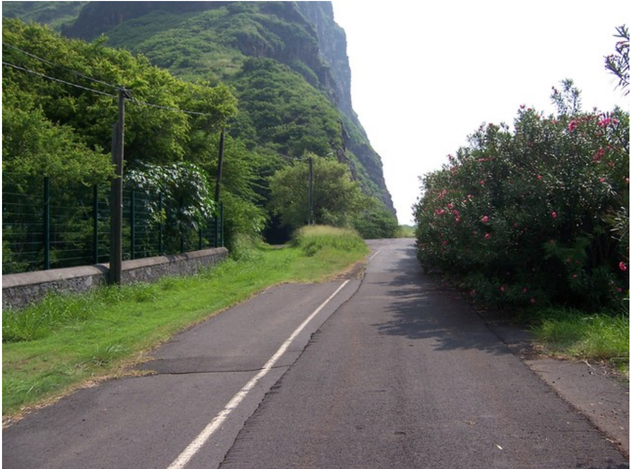
L'entrée du tunnel à gauche de l'ancienne route (27/02/2005)