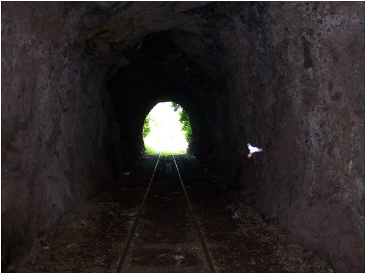
L'entrée du tunnel vue depuis la galerie (27/02/2005)