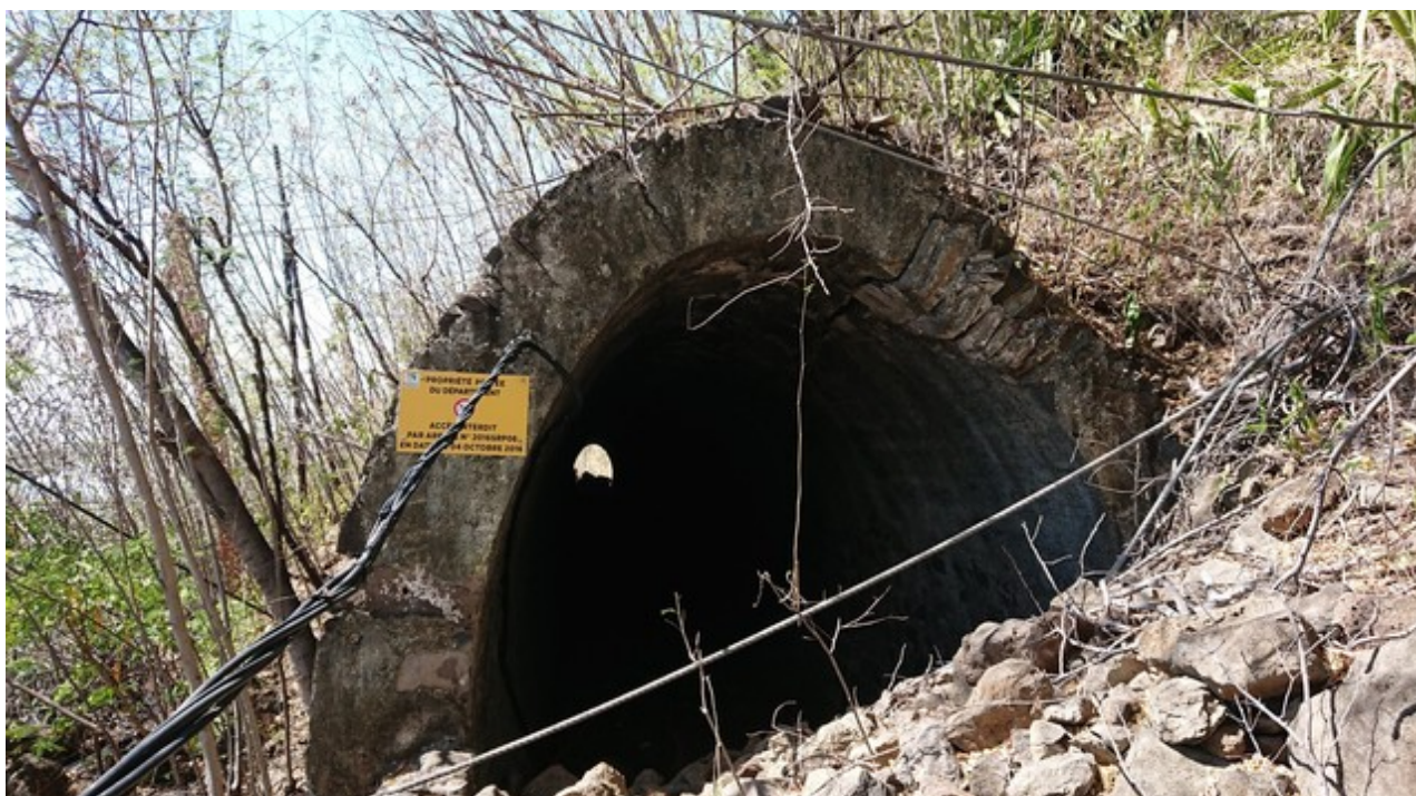
Photo de 2019 montrant la sortie du tunnel